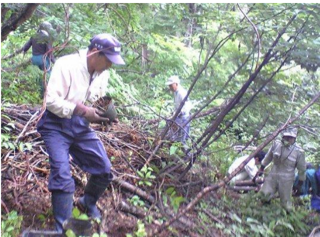
ウスバサイシンの植え付け作業の様子