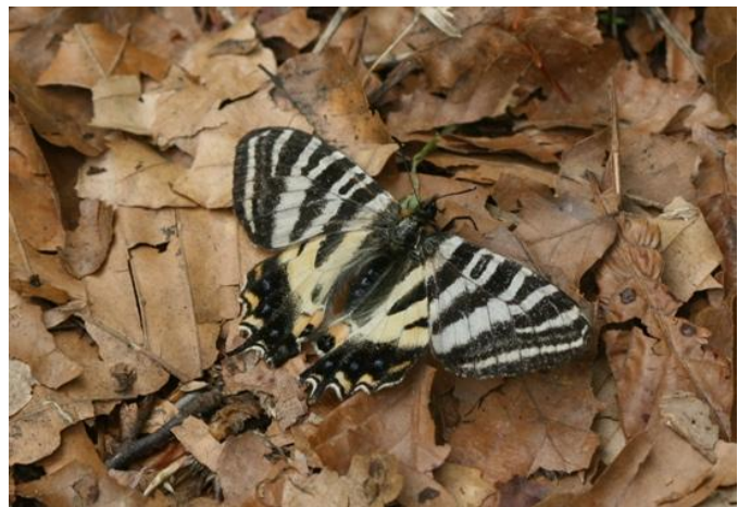
ギフチョウ：6月19日、黒岩山にて発生盛期を過ぎ、飛び古して翅が擦れた♀がブナ林内で体を休めていました。