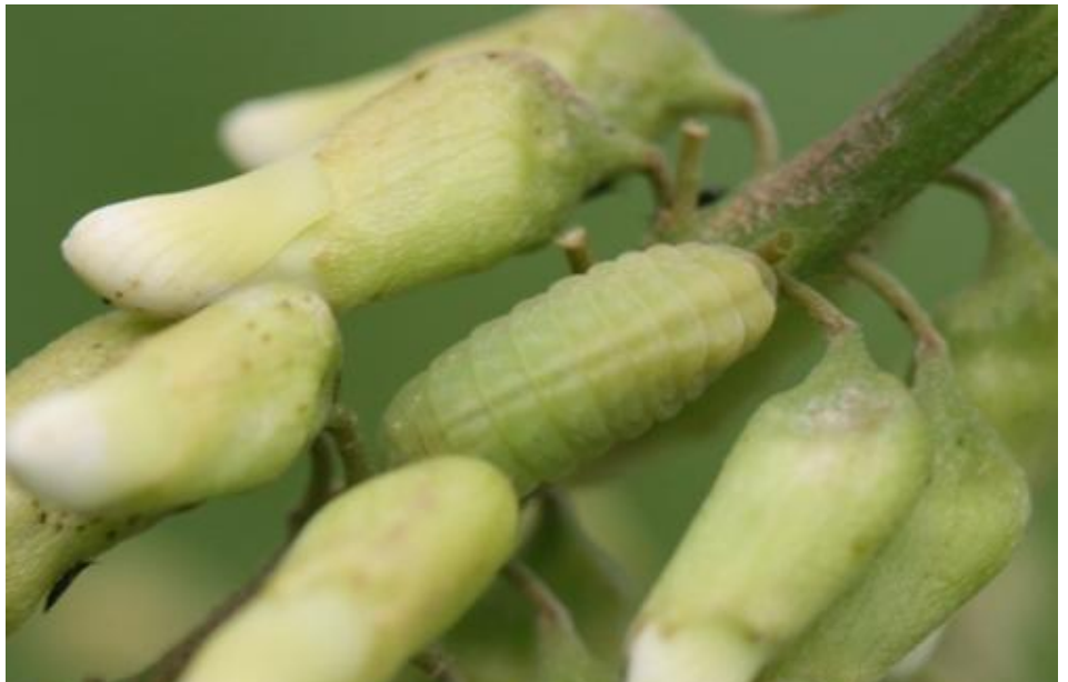
7月2日に観察されたオオルリシジミ（3齢？）幼虫

午後1時頃、解散とします。参加を希望される方は飯山市公民館に御連絡のうえ、お集まりください。