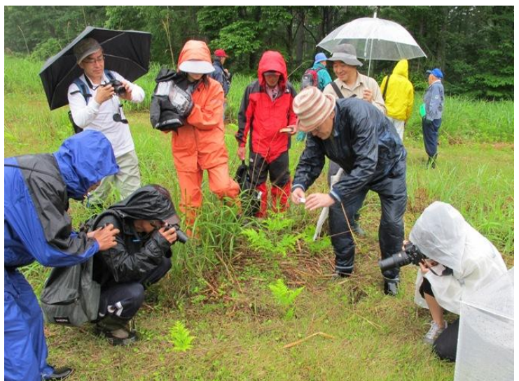
観察会の様子：写真撮影する参加者

また、当日は飼育法の説明会も行われ、希望する会員に飼育のお手伝いをいただこうかと思っておりましたが・・・。