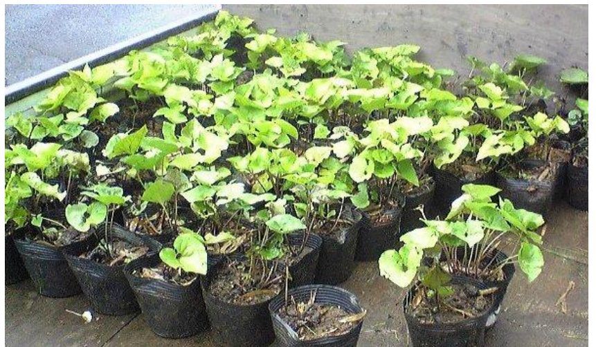
移植用のウスバサイシン

6月26日（日）には、ヒメギフチョウの食草であるウスバサイシンの植え付け作業が行われ、本年も保全活動への取り組みが本格化しました。次回は7月31日（日）に刈り払い作業を予定していますので、御協力いただける方は、飯山市公民館へ御連絡の上、参加をお願いします。