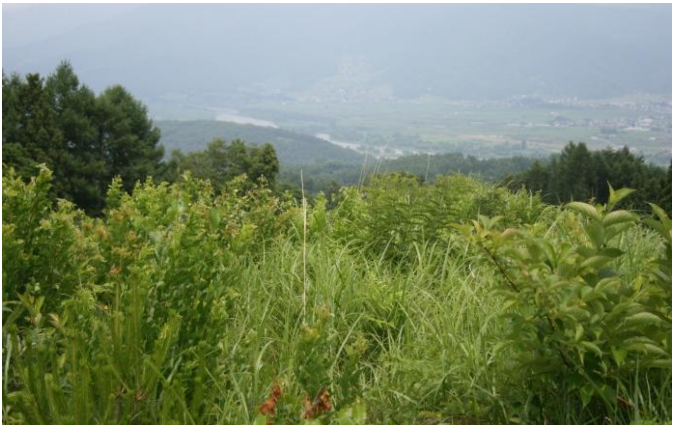
飯山市内のオオルリシジミ生息地

里山を元気にするには、まず、その一員である私たちが元気を出さなければなりません。北信濃の里山を熱く語れる人を毎年増やすこと。これが会としての当面の目標です。今後とも皆様の一層のご支援ご協力をよろしくお願いいたします。