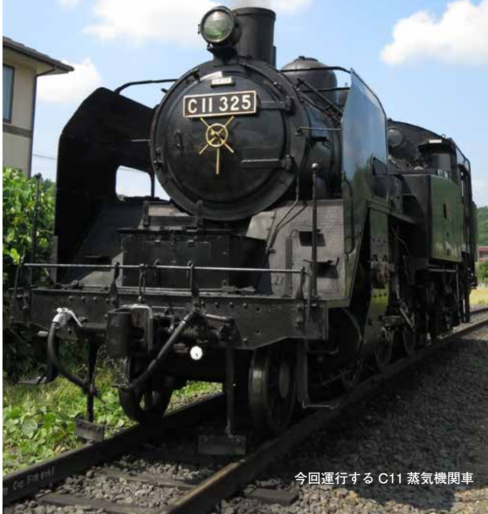
今回運行する C11 蒸気機関車