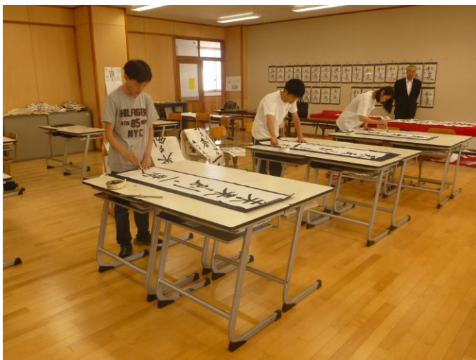
先月の揮毫時の様子