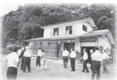
○神戸住宅 神戸区の個人から寄付を受け若者住宅へ。建物自体は平成元年に建築されたもの。

○小菅の里の家（仮称） 地域振興を目的に地域おこし協力隊員を中心に、宿泊と体験をセットにし、小菅の文化や自然に触れてもらえるような宿泊施設を地元と活用方法を検討中。