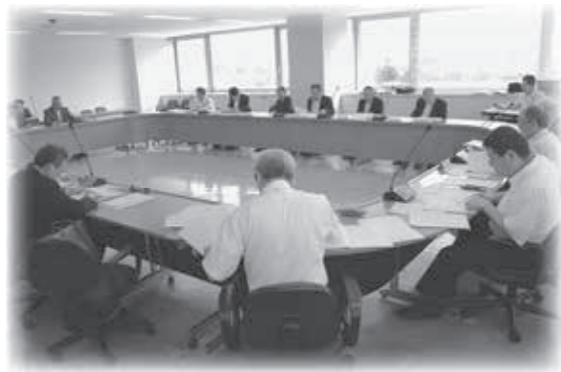
予算決算常任委員会全体会の様子

また、最終日には議会運営委員会から「道路整備事業に係る補助率等の嵩上げ措置の継続を求める意見書」・「核兵器禁止条約に賛同し、批