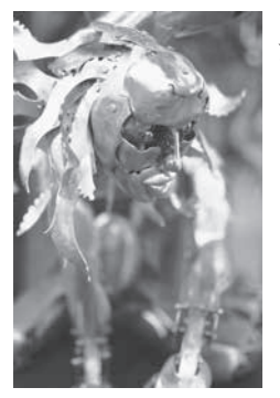
中村さんが手がける作品は、金属造形というジャンルで、時代背景としては、1800年

いいひと はっけん #146 E(エ)ネルギッシュな E(イー)ヤマの皆さんを紹介します