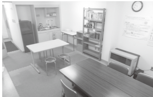
福祉センター1階奥 市民活動センター