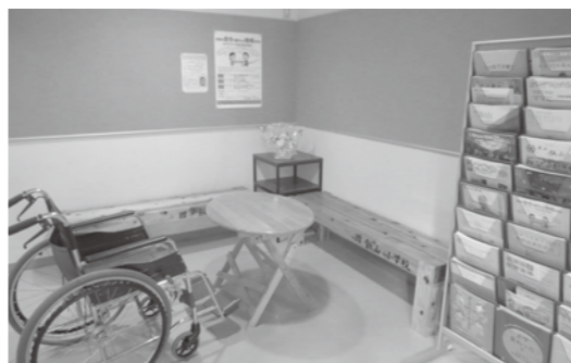
福祉センター玄関横 フリースペース

また、福祉センター1階エ レベーターホールにフリース ペースを作りました。新たに 設置された掲示板には、随時 ボランティア情報等を掲示し ていく予定です。ご覧くだ さい。