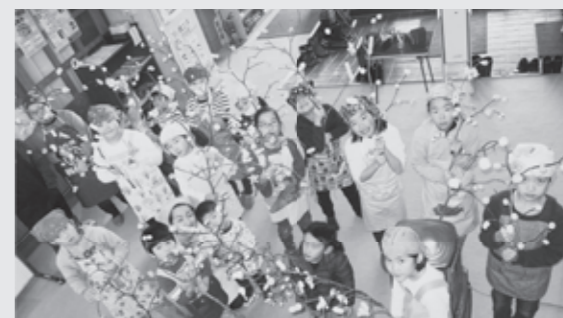
笑顔の花がいっぱい！ 体験教室 まゆ玉作り

「体験教室 まゆ玉作り」開催しました。 ふるさと館では、地域の伝統文化を学ぶ体験教室「まゆ玉作り」を1月12日に開催、市内の親子23人が参加しました。 まゆの形のほか、小判や動物、くだものなどたくさんの形を作った子供たちは、実り豊かな年になるよう願いを込めながら、ミズキの枝に飾りました。