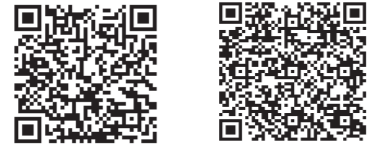
スマートフォン版 携帯電話版

図書館カレンダー、図書館からのお知らせ、ご利用状況、貸出・予約ランキングなどの確認と、蔵書検索と資料の予約、新刊・新着資料検索、パスワード変更などができます。