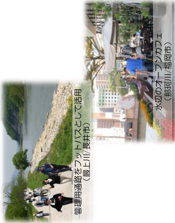
管理用通路をフットパスとして活用 (最上川/長井市)