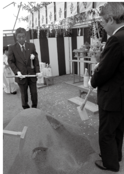
① 安全祈願祭での献入れ

【工事内容】 長峰トンネル工…110メートル 橋台工…3基 橋脚工…1基 カルバートボックス工…1箇所 ライメン高架橋工…30メートル スノーシェルター・シールド工…157メートル