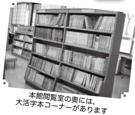
本館閲覧室の奥には、大活字本コーナーがあります