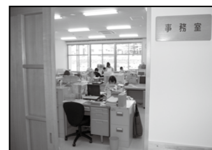
④右手に事務室があります