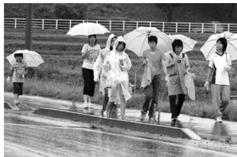
秋津・中町地区の様子

7月18日(土曜日)を中心に、お盆までの間、各地区・集落(字町)において「わがまち みんなで クリーン作戦」が実施されました。地域の児童生徒を中心とする青少年と地域内のゴミ拾い等を行うことで、共に地域に役立つ自己意識を高めていただくことを目的に活動していただきました。また各地区・集落以外で