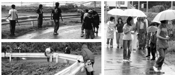
木島・山岸地区の様子 秋津・中町地区の様子

7月18日(土曜日)を中心に、お盆までの間、各地区・集落(字町)において「わがまち みんなで クリーン作戦」が実施されました。地域の児童生徒を中心とする青少年と地域内のゴミ拾い等を行うことで、共に地域に役立つ自己意識を高めていただくことを目的に活動していただきました。また各地区・集落以外で