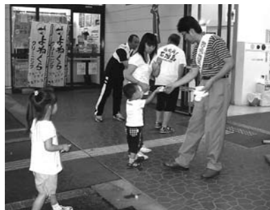
Aコープみゆき店での様子

この運動は、それぞれの地域の青少年に、周りの大人の誰もが温かなまなざしを向け声かけをし、積極的