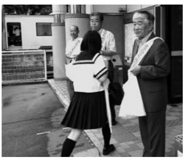
JR 戸狩野沢温泉駅での様子

7月は「青少年の非行問題に取り組む全国強調月間」「あいさつ・愛の声かけ運動」が市内各地で実施されました