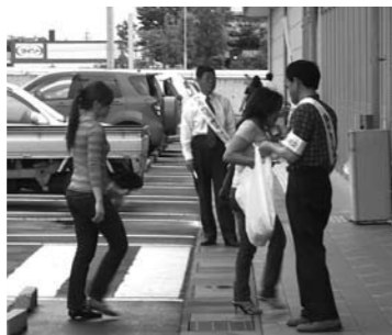
ベイシア飯山店での様子

にかかわることを通して青少年の健やかな成長を支援していこうという運動です。大人から進んであいさつをし、すべての大人が、様々な声かけにより具体的に青少年に関わることが出来る社会を目指しています。これからも皆さんのご協力をお願いします。