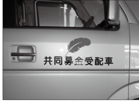
共同募金受配車です

「赤い羽根共同募金」からの特別配分でいただいた「軽ストレッチャーカー」です。これは、介助者がいれば、車イスのままどこへでも行ける車です。 飯山市福祉センターまで来ていただければ、どなたでもご利用いただけます。利用料は無料ですが、燃料代のみ負担していただくことになっております。 使い方 下の写真のとおり、まず後部ドアを開いてステップを下ろし、さらにステップを引いたら、あとは牽引