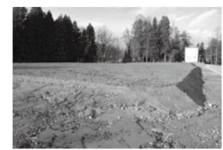
△建物解体され更地となった岳北クリーンセンター跡地。

岳北クリーンセンターは、それまで牛ヶ首にあった、ごみ処理施設の老朽化に伴い、昭和58年から建設を始め、昭和60年4月1日に稼動。以来、平成21年1月までの約24年間、岳北地域の住民が安心して暮らすための重要な施設としての役割を担い続けてきました。