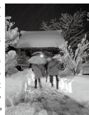
△大晦日、西敬寺に訪れる皆さん。通路にはローソクの火が灯されていました。

12月31日、その日午後からの大雪に見舞われた飯山市内でしたが、各所で二年参りに出かける市民の皆さんの姿が見られました。