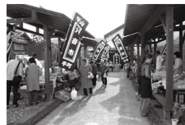
△商店街活性化の拠点となっている六斎市。

六斎市は地元の皆さんが来店し6月から12月までの『2』と『6』のつく日に開催。対面形式で農産物や食品などを販売し賑わいや交流の場を作り出したほか、他団体と連携し環境やまちづくりについての学習会や、マイ箸づくりを行うなど、活動の大きな広がりも見せており、地域活性化の波及効果なども評価されました。