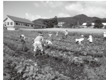
①猛暑のなかの草取り。