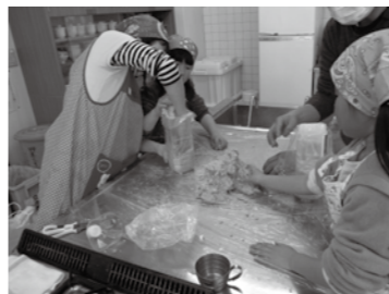
④みそ玉をペットボトルにつめる。半年後完成です。