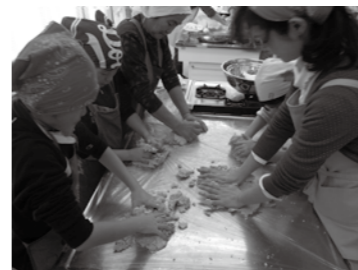
③つぶした大豆と麴、塩をまぜる。

今年度は10組23名の親子が参加し、大豆・そばの種まきから始めて、豆腐・味噌・納豆を作る作業を行いました。主なスケジュール 6月 開講式と大豆の種まき 7月 2回の草取り 8月 そばの種まき 9月 枝豆を収穫してずん