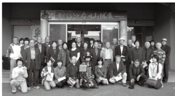
△視察先の上越市埋蔵文化財センターにて

ます。 会員特典 ・ふるさと館の入館料が年間無料 ・ふるさと館主催の行事の参加費免除 ・会誌「奥信濃文化」(研究誌・年2回発行)を配布 ・友の会をたよりにて、随時ふるさと館情報をお知らせ 詳しくは、飯山市ふるさと館までお気軽にお問合せください。 電話 67-12030