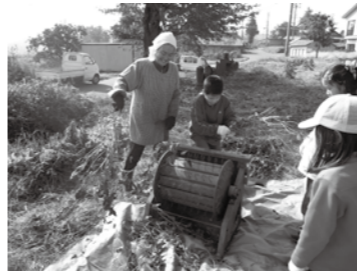
②足踏み脱穀機を使って豆はたき。

ふるさと館では、親子食文化講座「大豆とそばを育ててみよう！」を開催しました。この講座は平成19年度からはじまり今年度で4年目になります。講座は、大豆の種まきから収穫、そして食品への加工までを1年間を通して親子で体験しました。今年度はそば作りにも挑戦しました。