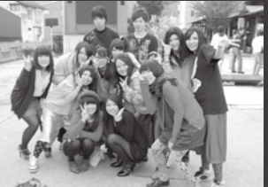
飯山高校ダンスサークルの皆さん