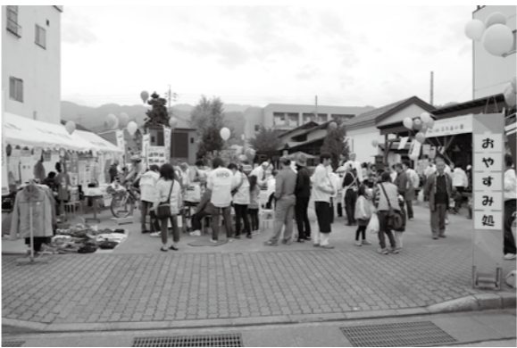
朝から大勢の皆様がお越し下さりました

11月3日(祝)に飯山市福祉センター周辺を会場に『ふれあい祭』が行われました。ぶらり広場・福祉センター駐車場では、赤十字奉仕団飯山分団の「チャリティーバザー」や飯山市更生保護女性のバザー、飯山地区子ども