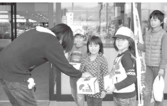
元氣良く募金活動しました