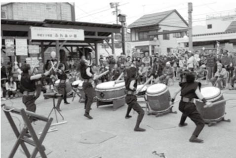
各団体による華麗なステージ発表に足を止めていました

会育成連絡協議会によるチャリティー「餅つき」が行われました。ぶらり広場特設ステージでは、ステージ発表が行われ、鬼島太鼓、常岩の里ながみねの木つ端薪(こつばまき)合唱団の皆さん、市内高校生による音楽バンドやダンスステージが行われました。また、福祉センター館内では、高齢者・障がい者作品展