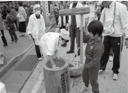
もちつきや共同募金運動も行われました

会育成連絡協議会によるチャリティー「餅つき」が行われました。ぶらり広場特設ステージでは、ステージ発表が行われ、鬼島太鼓、常岩の里ながみねの木つ端薪(こつばまき)合唱団の皆さん、市内高校生による音楽バンドやダンスステージが行われました。また、福祉センター館内では、高齢者・障がい者作品展