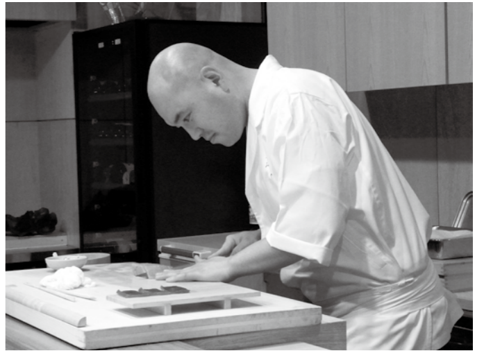
E(エ)ネルギッシュな E(イー)ヤマの皆さんを紹介します