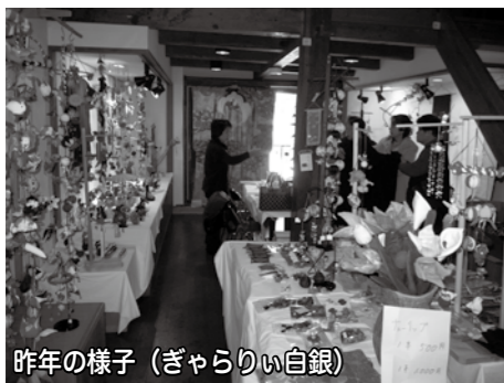
昨年の様子（ぎやらりの白銀）

期日 2月5日(火)から3月24日(日) 午前9時～午後6時 (入館は午後5時30分まで) 場所 ふるさと館 入館料 大人200円 小・中学生100円 ※市内の小中学生は無料 (なつかし玩具大集合も 同時開催) お問い合わせ ふるさと館 ☎072030