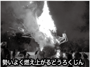
勢いよく燃え上がるどうろくじん