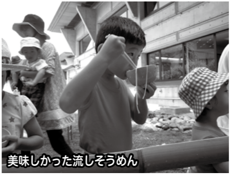
美味しかった流しそうめん

普段はなかなか体験できないことを体験して、参加者みなさんからも「充実していて楽しかった」「良い体験ができた。」などの感想をいただくことが出来ました。