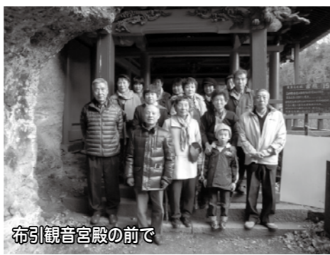
布引観音宮殿の前で

最後に旅の汗を「あぐりの湯こもろ」で流し、楽しかった旅も終わり。心配していた天気も大きく崩れることはありません、充実したバスハイクになりました。