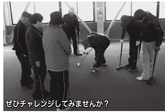
ぜひチャレンジしてみませんか？