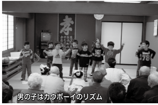
男の子はカウボーイのリズム

12月11日(火)に今年3回目の「茶話会」を開催し、今回はいずみだ保育園の子供たちに富倉まで来てもらいました。