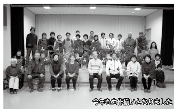
今年も力作作りとなりました

12月19日(水)太田公民館運営審議会を開催しました。1年間の活動についての反省や来年度に向けての要望や意見が多数出されました。