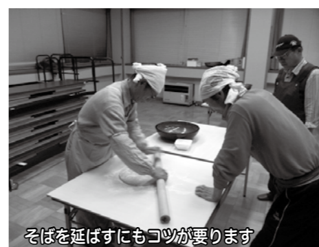
そばを延ばすにもコツが要ります

恒例となっているそば打ち道場を今年は12月6、13、22日の全3回の講座で開催しました。