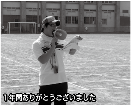
1年間ありがとうございました

作った館報を皆さんがどのように読んでくれているのか、内容は伝わっているのかとても心配でした。「館報読んだよ」と声をかけていただいたときはやりがいを感じました。そんな日々が懐かしいです。今はそうして作った館報が形として残っていて、いい思い出です。公民館行事を通して地元で協力できたことが嬉しく、大変貴重な体験が出来たと思っています。いろいろな形で少しでも地元の活動に参加できたらと感じました。