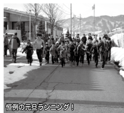
恒例の元旦ランニング!

元旦恒例の行事「元旦ランニング(健康祈願祭)」が平成25年の木島公民館活動として元気にスタートしました。