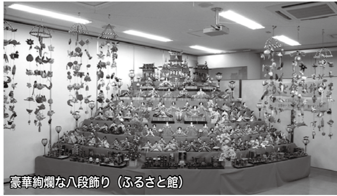
豪華絢爛な八段飾り（ふるさと館）

時代で彩る八段飾り 享保雛から現代雛まで 時を重ねて受け継がれてきた 雛人形を一堂に展示