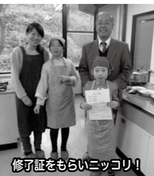
修了証をもらいニッコリ!

今年度は「じゃがいもを育てておいしく食べよう!」ということで、講師に食文化の会の先生方をお迎えし、6月に種イモを育てるところから、毎月1回作業をしました。収穫したじゃがいもを使って、いろいろな郷土料理を作ることまで、皆さんの体験をしました。参加した子どもたち、お父さん、お母さんの笑顔がはじける講座でした。参加された皆さん、ありがとうございました。