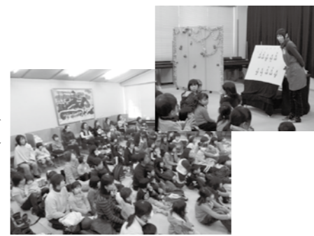
クリスマスおはなし会の様子

12月16日(日)にクリスマスおはなし会を開催し、子どもと保護者83名の方にご参加いただきました。 当日は、おおきなえほん「おぼけのバーバパパ」やパネルシアター「10にんのサンタ」を行い、大変好評でした。