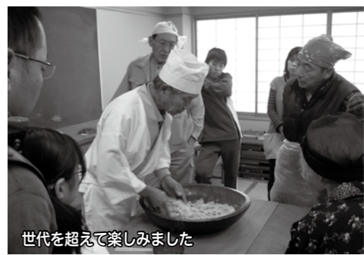
世代を超えて楽しみました

な方が参加し、「自分で打ったそばで年越しそばを！」とみなさん真剣に取り組んでいました。最後には講師の打たれたそばで試食をしながら、そば談義に華が咲きました。