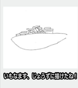
いもなます、じょうりに揚げたね!

はじめは洋風のりょうりしか知りませんでした。だけど、じゃがいものタネいもをうえて、そだてて、にっこりがしや、かたくりこ、いもなますも作って、じゃがいもは、洋風だけではなく、和風のりょうりにも、すがたをかえていることがわかって、よかったです。学校でおしえてくれないことなどが、わかりました。夏は、暑い中、草とりをして、たいへんだつたけど、仕事をしたあと、たべたアイスクリームは、とくべつにおいしかったです。来年は、そばを作ってみたいです。また来年が楽しみです。