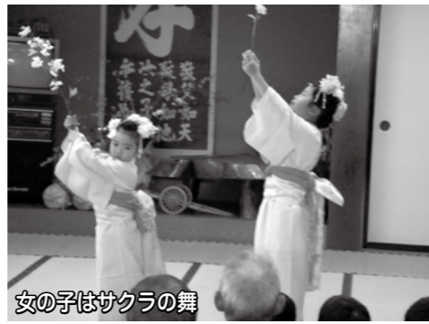
女の子はサクラの舞

12月8日(土)毎年恒例の「ふれあいバスハイク」を開催しました。今年も総勢17人で軽井沢・小諸を訪問。