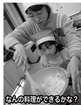
なんの料理ができるかな?

今年度は「じゃがいもを育てておいしく食べよう!」ということで、講師に食文化の会の先生方をお迎えし、6月に種イモを育てるところから、毎月1回作業をしました。収穫したじゃがいもを使って、いろいろな郷土料理を作ることまで、皆さんの体験をしました。参加した子どもたち、お父さん、お母さんの笑顔がはじける講座でした。参加された皆さん、ありがとうございました。