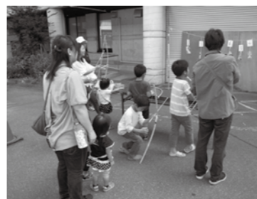
「弓矢」景品を射抜いてゲット!!