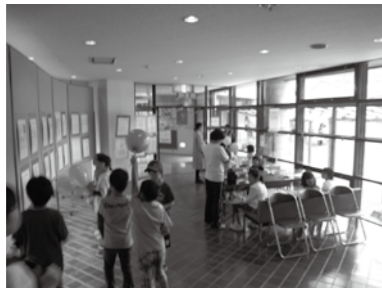
公民館からの通路のようす

また、公民館からの通路は、「パンの販売」や休憩所として利用していただき、来館者で賑わっていました。