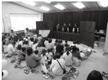
「芭空」の皆さんの人形劇

また、「本のリサイクル市」も両日同会場で行いました。例年どおり本1冊10円でご購入していただき、多くの皆さんで賑わい、1,669冊をお買い上げいただきました。なお、「本のリサイクル市」用として市民の皆さまから多数の本を提供していただきありがとうございます。売上金16,690円については、市の収入とさせていただきます。図書購入費に充てます。