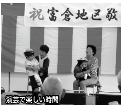
演芸で楽しい時間

またアトラクションでは、有志の皆さんによる腹話術、寸劇、踊りなどの演芸を披露していただき、楽しい時間を過ごしました。