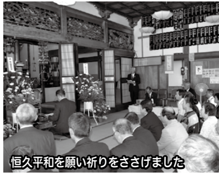
恒久平和を願い祈りをささげました

たが、戦没者開拓殉難者に対し追悼し、過去の戦争の時代を風化させず後世に語り継ぎ、恒久平和を実現するために、この式典が毎年継続されていることは大事なことです。