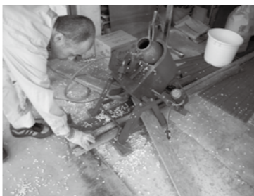
「とっかん」製造のようす

図書館前庭では5日(土)に「とっかん」(お米のお菓子)を製造し無料配布を行いました。とっかんは、気温が高いこともあり、張り付いて上手く出来ないこともありましたが、今年は麦のとっかんにも挑戦し、お客さんには懐かしさと大変好評でした。