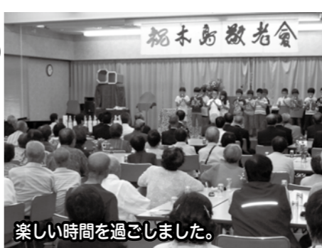
楽しい時間を過ごしました。

9月16日(月・祝)、木島公民館において開催されました。当日は台風の接近により悪天候となりましたが、77歳以上の敬老者及び関係者約120名が集まりました。また、アトラクションでは木島小学校3年生の合唱やマジックショーがあり、会場は拍手や笑いに包まれ楽しいひと時を過ごしました。