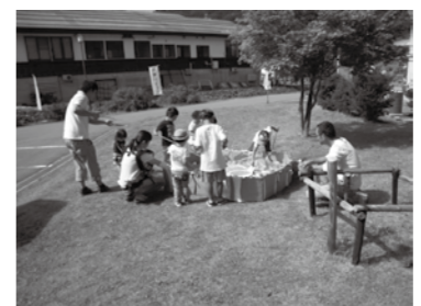
「さかな釣り」たくさん釣れたかな?