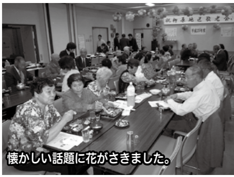
懐かしい話題に花がさきました。

9月15日(日)大川会場、16日(敬老の日)柳原地区活性化センター会場において敬老会を開催し、両会場合わせて100名を越える敬老者をお迎えしました。台風で強い風が吹きあられ、枝は折れるくらい強い風の中でしたが、和やかな雰囲気の中、心に残るひとときを過ごされました。