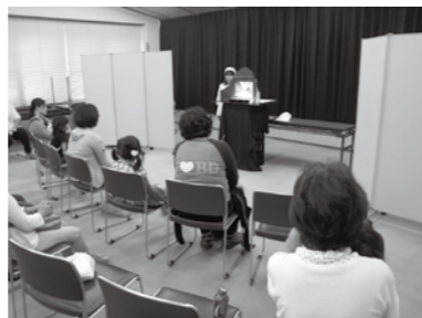
「でこぼこ座」の皆さんの紙芝居

皆さんによる楽しい紙芝居をたくさん演じていただき、大勢の皆さんにご鑑賞をいただきました。