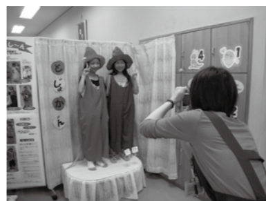
「へんし〜ん」して写真を撮りパチリ!!