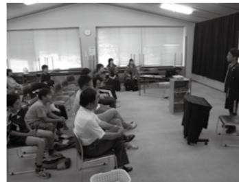
「ピブリオバトル！」マンガ部門のようす

本年度の図書館まつりを10月5日(土)・6日(日)に総合学習センターフェスティバルの一つとして開催し、約1200名の皆さまにご来館いただきました。両日共に9時30分からイベントを開始しました。今年の目玉は、初の開催となった「ピブリオバトル」です。