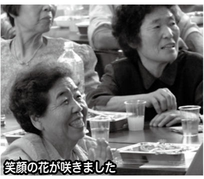
笑顔の花が咲きました

9月25日(水)にトピアホールを会場に敬老会および合同金婚式が開催され、134名に出席いただきました。