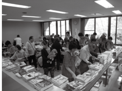
本のリサイクル市

6日(日)には「おはなしまつり」と題し、人形劇グループ「芭空」の皆さんによる愉快な人形劇、「どろぼうがつこづ」や、「でこぼこ座」の