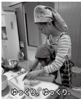
ゆっくり、ゆっくり。

今年度は、 ・第1回「じゃがいも植え」 ・第2回「いもの土寄せと草取り」 ・第3回「じゃがいも掘り」 ・第4回「秋野菜の種まき」 ・第5回「田植え煮物作り」 ・第6回「白菜キムチ作り」 飯山食文化の会の講師の先生方より、畑での野菜作りや郷土料理作りなど、家ではなかなか体験できないことを毎回いいねに教え