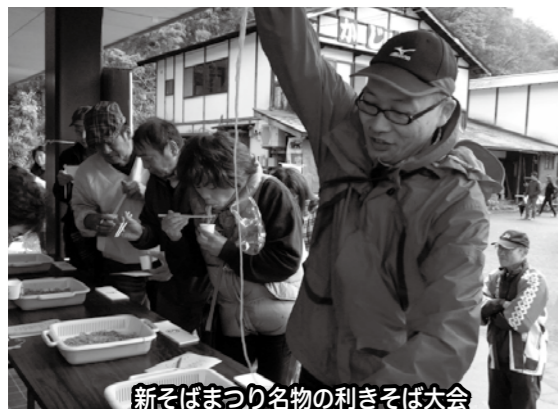
新そばまつり名物の利きそば大会

ポイントめぐり」の途中で立ち寄りさせていただき、活気ある「富倉」を感じるものが出来ました。参加者からは「初めて新そば祭りに来ることが出来て嬉しい。飯山町内に住んでいて、富倉まで来るのもおつくだと思ってしまうのだから、逆に昔の方が飯山町内まで来るのには大変な苦労だったと思う。美味しいそばを食