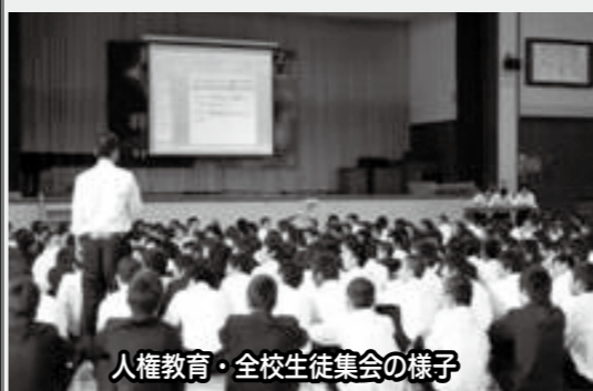
人権教育・全校生徒集会の様子

これだけよいと言うことはない。常に生徒を取り巻く状況や生徒自身の内面は変わっていく。人権感覚は、常に磨いていかないと、鈍くなってしまう。できることは着実に積み重ね、もう少しでできることとは確実に身につけ、できることはよりよくできるように高めていけるように生徒と共に磨いていきたい。