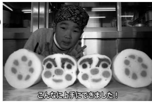
こんなに上手にできました！

11月30日(土)木島公民館において開催しました。15名の参加者が地元の米粉を使い、おもいおもいの「やしようま」作りに挑戦しました。日本の食文化を学ぶ有意義な料理教室となりました。