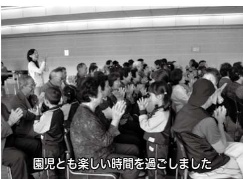
園児とも楽しい時間を過ごしました

終了式では、皆勤賞16名、精勤賞(1回欠席者)11名に賞状と記念品が贈られました。また、前期・後期の各4回以上の出席者16名には修了証