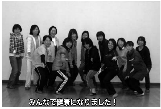
みんなで健康になりました！