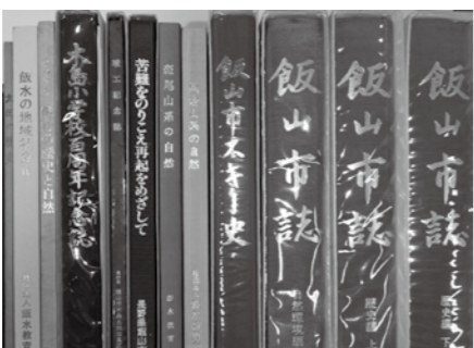
たくさんご寄贈いただいた本の一部です

も『飯山市誌』や『木島小学校百周年記念誌』、『苦難をのりこえ再起をめざして』など、市民のみなさんからたくさんのご寄贈をいただきました。大切に所蔵・活用させていただきます。