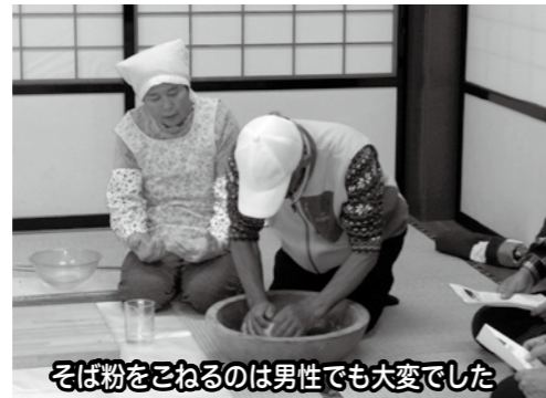
そば粉をこねるのは男性でも大変でした

ポイントめぐり」の途中で立ち寄りさせていただき、活気ある「富倉」を感じるものが出来ました。参加者からは「初めて新そば祭りに来ることが出来て嬉しい。飯山町内に住んでいて、富倉まで来るのもおつくだと思ってしまうのだから、逆に昔の方が飯山町内まで来るのには大変な苦労だったと思う。美味しいそばを食