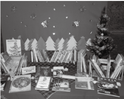
ぜひ手にとってご覧下さい

図書館2階閲覧室入り口に、今月は「クリスマス」と題し、テーマコーナーを設けています。 『ノエルのひみつ』・『赤毛のアン』・『クリスマスブック』・『マドレーヌのクリスマス』・『サンタクロースからの手紙』などの本を取り揃えてあり貸出が出来ます。