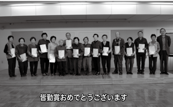
皆勤賞おめでとうございます

◆本年の老燃教室無事終了 4月9日から、前期8回、後期7回の計画で始まりました平成25年度老燃教室が11月26日に最終日を迎え終了式が行われました。