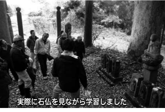
実際に石仏を見ながら学習しました

11月10日(日)ふるさと百選選定事業瑞穂地区実行委員会と共催で、「瑞穂の石造文化財をたずねて」と題し学習会を開催しました。