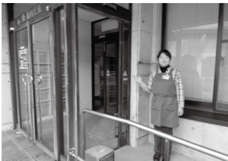
こちらからお入りください!

いよいよ寒くなってきましたね。図書館西側の階段を上がる入口は、冬になると凍って転倒の恐れがあり大変危険なため、冬期間は閉鎖とさせていただきます。同じ入口の南側スロープから入館いただけますようお願いいたします。ご不便をお掛けして申し訳ありません。