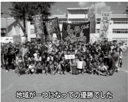
地域が一つになっての優勝でした

と、「今日も速くなるように一緒に走ってください！」と言つてきてくれること、本当に涙が出てしまうくらい嬉しく、そのたびに感動させられました。この木島に生まれ育ち、同じ場所を尊敬するコーチの方々と現在も活動でき、苦しくても諦めずに走り続ける子どもたちの輝いている姿を見られるということにとっても幸せを感じています。