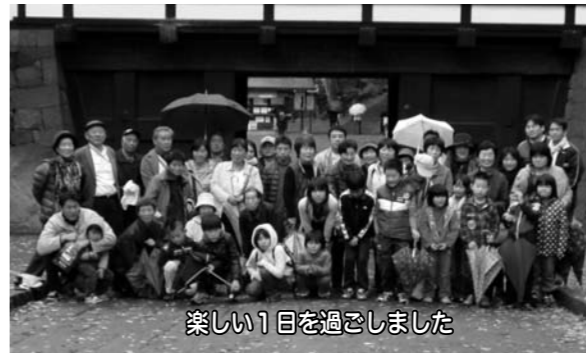
楽しい1日を過ごしました

11月10日(日)秋津公民館と地区育成会の共催で佐久・小諸方面へバスハイキングを行いました。