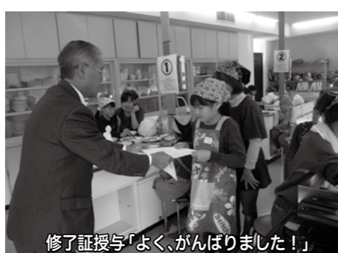
修了証授与「よく、がんばりました！」

なりました。(参加・母) *しつかり手をかけて食べる大切さを学ぶことができました。(参加・母) 参加された親子11組のみ なさん、ありがとうございます。