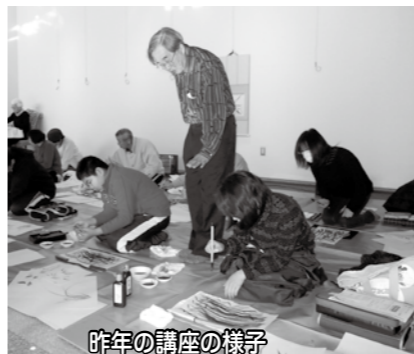
昨年の講座の様子