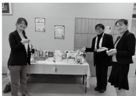
「お気軽にどうぞ～」と信大工学部図書館スタッフ

また、来年の1月末まで市立飯山図書館カウンター前特設コーナーに、信州大学工学部図書館が46冊の所蔵本を出張展示しています。図書館にご来館の際は、ぜひご覧下さい。