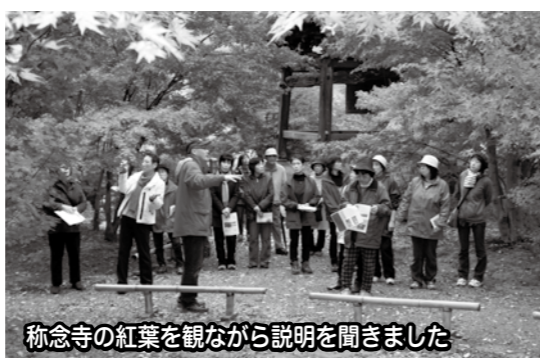
称念寺の紅葉を観ながら説明を聞きました

るのに、機会が無ければ来ることが無かったので嬉しい。などとおっしゃられていました。