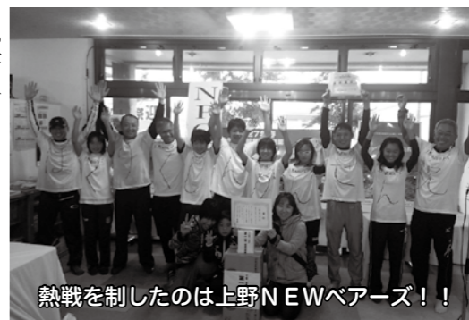
熱戦を制したのは上野NEWベアーズ!!