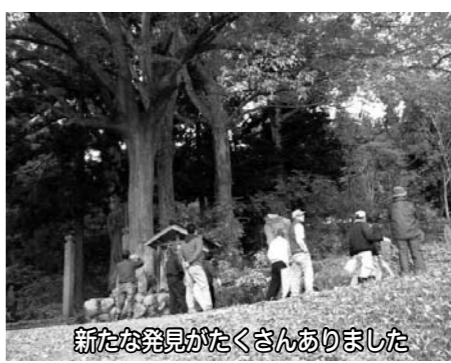
新たな発見がたくさんありました

い・知らないという人が以外に多いのが実情です。過去より今に伝えられた石造文化財を保全し、後世に残していくために、まずは学習する必要があります。ということで企画されました。