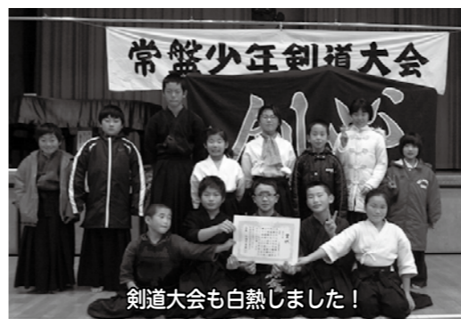
剣道大会も白熱しました!