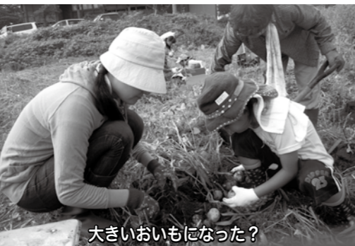
大きいおいもになった？

今年度は、 ・第1回「じゃがいも植え」 ・第2回「いもの土寄せと草取り」 ・第3回「じゃがいも掘り」 ・第4回「秋野菜の種まき」 ・第5回「田植え煮物作り」 ・第6回「白菜キムチ作り」 飯山食文化の会の講師の先生方より、畑での野菜作りや郷土料理作りなど、家ではなかなか体験できないことを毎回いいねに教え