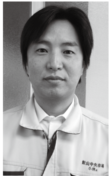
友人とお酒を飲むのが好きです。休日は良く寝て、仕事に備えます。 E(エ)ネルギッシュな E(イー)ヤマの皆さんを紹介します