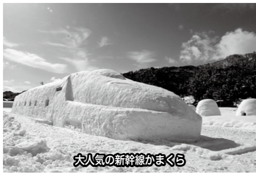
大人気の新幹線かまくら

期間が延長された「レストランかまくら村」の営業も3月2日で終了し、今年のかまくらシーズンは既に終了しましたが、来年もよりよいかまくら祭りを目指していきますので、今後よろしくお願ひ申し上げます。◇春の利きそば会 3月2日(日)「春の利きそば会」を開催しました。この利きそば会は、地区内で採れたそばの地粉を使い、地区内のそば打ち名人が集まって、それぞれの持ち味を食べ比べて楽しむというものです。そば粉は地元産の同じ粉を使うもの、お馴染みのオヤマボクチをつなぎで使う方、小麦粉を使った一般的な二八そばを打つ方と流儀は人それぞれ。参加者がその違いを楽しむのはもちろん、打ち手同