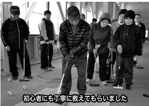
初心者にも丁寧に教えてもらいました

◇飯山地区ゲートボール大会 晴天に恵まれた2月23日(当)日の参加を含めて20名の参加者により、8時45分から市屋内運動場でゲートボール大会を開催しました。