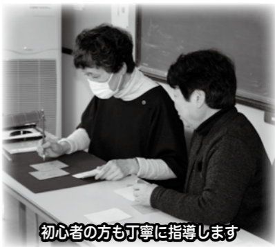
初心者の方も丁寧に指導します

この講座は教室での学習だけでなく、毎年テーマを決めて学び、旅にも出ています。「おくの細道」がテーマの年には、深川の芭蕉庵から草加までの旅をし、昨年は「二茶」を学び、高山村、小布施町への旅もいたしました。