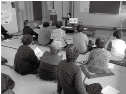
市立飯山図書館 電話②1118

最初に音読がもたらす脳への効果についての話をしたあと、参加者と一緒に「シルバール川柳」や「早口ことば」などで元気に声を出し合いました。また、手先の運動として「後出しジャンケン」を行い、最後は紙芝居でリフレッシュ！14名の参加者と充実した楽しい時間を過ごすことができました。