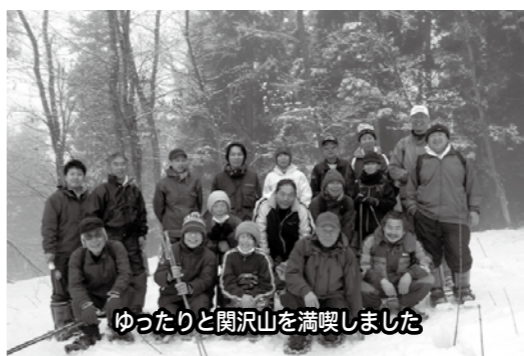
ゆったりと関沢山を満喫しました

歩き、目的地の関沢山へ。山頂からは眼下に飯山盆地が一望できる予定でしたが、当日はあいにく霧が濃く、眺望は望めませんでした。しかし、幻想的な霧囲気の中、初めてスノーシューを履く方からベテランの方まで、半日と短い時間ではありましたが、ゆったりと冬の関沢山を満喫していただけたのではないのでしょうか。