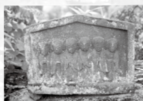
いっせきろくじょう 一石六地藏

六地藏は、人々が六道(地獄・餓鬼・畜生・修羅・人間・天上)のどこにいても救いの手を差し伸べてくれるということから、六つの分身として造られたお地藏様です。お寺などの入り口でよく見かけます。江戸時代になると、さまざまな形態の六地藏が造られるようになります。秋津北畑の法伝寺2号古墳の頂上には、飯山では珍しい一つの石に六体のお地藏様が彫られた一石六地藏があります。身近で親しみを感ずる表情の石仏です。