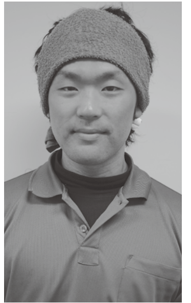
長野県の代表として、もう一度全国の舞台で入賞したい。