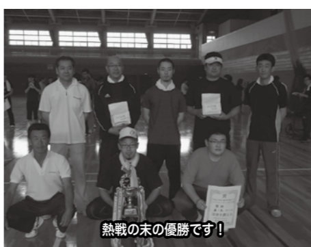
熱戦の末の優勝です!

6月22日(日)の大会当日は、雨天のため男子はソフトボールを、ソフトバレーボールに変更して、男女ソフトバレーボールで開催し、熱戦が繰り広げられました。