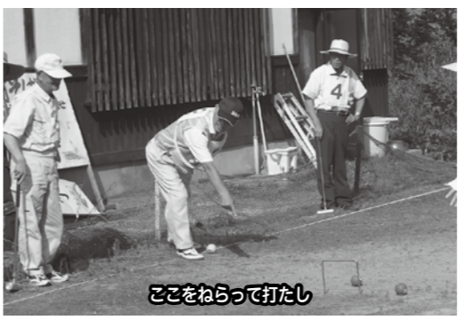
ここをねらって打たし

6月6日(日)に、初夏の茶話会として湯の入荘へ行きました。21人が参加し、脳内イキイキ教室の見学や昼食時の世間話などで楽しい一日を過ごしました。