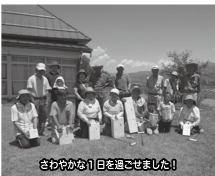
さわやかな1日をご過ごせました!

マレットゴルフ場にて開催されました。 当日は爽やかな青空の下、日頃からマレットゴルフをやっている方から初心者まで、みなさん一緒になって楽しむことができました。