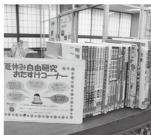
▲「夏休み自由研究おたすけコーナー」 絵や工作、科学実験などいろいろあって悩むかも・・・

図書館2階児童書付近に夏休みの自由研究に役立つ図鑑や工作などの本を揃えたコーナーを設置しましたので、是非、活用して下さい。 なお、このコーナーの本は、貸出しができませんので、図書館内でご利用いただき、ノートにメモするなどしてご利用ください。 また、1枚10円かかりますが、コピーもできます。