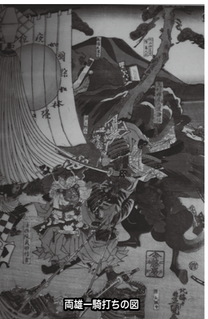
両雄一騎打ちの図