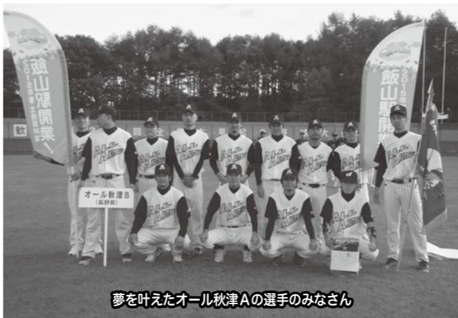
夢を叶えたオール秋津Aの選手のみなさん

平成25年9月27日、私は北海道千歳市千歳市民球場バックネット裏にいた。長野県下558チームの頂点に立ち自信と誇りを胸に堂々と入場行進するオール秋津Bの選手をビデオのファインダー越しに見ながらこみ上げるものがありました。思い起こせば今から4年ほど前、「3年以内で絶対優勝しよう」と誓い合ってからちょうど3年目、選手たちの小さな努力の積み重ねが実り優勝の栄冠を手に入れることができました。出場が決まっていた1年