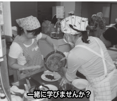
一緒に学びませんか?

ふるさと再発見講座 いいやまふるさと母の味 受講生募集 今回作る料理は おやき やたら ・日時: 8月7日(木) 19時~21時30分 ・場所: 飯山市公民館1階 調理実習室 ・持ち物: エプロン、三角巾 ・受講料: 200円 ・材料費: 300円 ・対象者: 飯山市内在住または在勤の方 定員: 20名 (定員に達し次第締め切り) 募集期間 7月22日(火)~ 7月31日(木) 問い合わせ・申込先 飯山市公民館 ☎3342