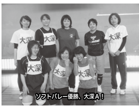
ソフトバレー優勝、大深A!

晴天に恵まれ、6月15日(日)に開催しました。唯一の地区対抗行事であり、世代を超えて交流することができました。