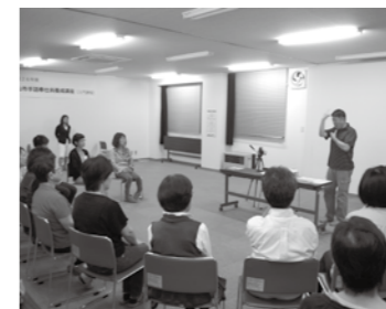
第一回講義の様子