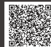
携帯電話でアクセス