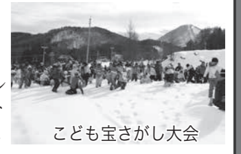
こども宝さがし大会