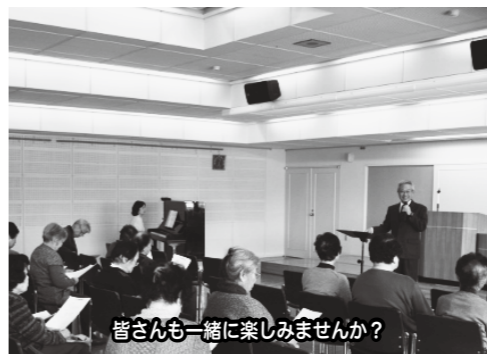
皆さんと一緒に楽しみませんか？

4月14日から「27年度老燃教室」が開講しました。この講座は、「老いてさらに元気に燃えあがる」を基本目標として、飯山市民館を会場に、老人クラブと共催で開催しています。