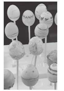
色づけには、クレヨンや食紅を使いました。

総合学習センター事業・春休み体験教室のひとつ『ブックトーク「春がきた! イースターってなあに?」&イースターエッグ作り』を図書館司書が担当し、3月24日に開催しました。 日本ではあまり馴染みがない「イースター(復活祭)」ですが、海外ではクリスマスやハロウィンと同じくらい大きなイベントだそうです。イースターでは、さまざまな模様をつけた卵をあちこちに隠して、子どもたちを探させる遊びがあるとのこと。今回、本物の卵のからにカラフルな模様をつけて楽しみました。