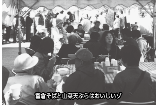
富倉そばと山菜天ぷらはおいしいゾ

厳しい冬が終わり春がやってくると、黒岩山にはカタクリの花が咲き、ギフチョウやヒメギフチョウが飛び交うようになります。そんな春の使者たちにも今年も会いに行きます。開催は5月中旬頃の予定です。詳しくは決まり次第、チラシや公民館ブログを通してお知らせいたします。