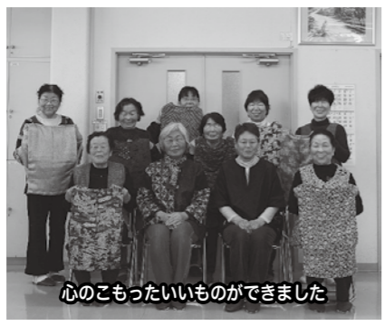
心のコもったいいものができました