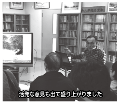
活発な意見も出て盛り上がりました

で使用する簡単なロープワークについて、教えていただきました。参加者からは、実際に登山について企画してほしい、この会を「山歩会」として地域の里山を「山歩会」としての意見があり、盛り上がりました。