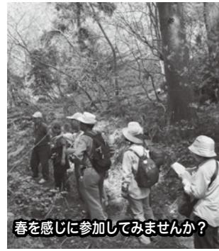
春を感じに参加してみませんか?