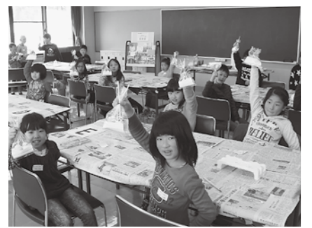
参加者は18名。完成した「イースターエッグ」は袋に入れてラッピングしました。