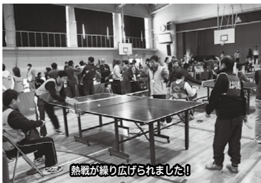
熱戦が繰り広げられました!

3月8日(日)、恒例の「楽しい集い」を開催しました。東小学校体育館ではピンポン大会を、瑞穂地区活性化センターでは囲碁・将棋・麻雀・オセロ大会を行い、それぞれの会場で熱戦が繰り広げられました。結果は次のとおりです。