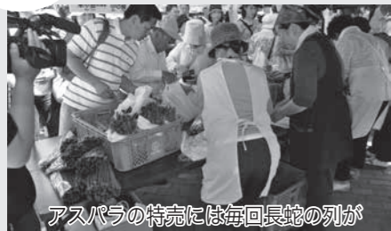
アスパラの特売には毎回長蛇の列が

5月31日 第3回 信越自然郷いいやまアスパラまつり 開催 農林課 農業振興係 ☎62-3111 内線 262・263