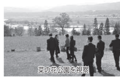
菜の花公園を視察