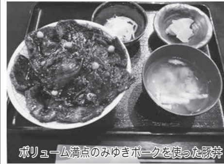
ポリューム満点のみゆきポークを使った豚丼

寺町を訪れた観光客と市民の皆さんに、地域の食材を活用し、魅力的な食を提供する飯山市の町屋「あたご亭」が4月10日、愛宕町の展示作館向かいにオープンし、初日から大勢のお客さままでにごわいました。 同店では、みゆきポークを使った豚丼、から揚げ、山賊焼きを3本柱としてメニューを提供し、他にも先に行われた北陸新幹線飯山駅オリジナル駅弁コンテストでグランプリを受賞した作品にアレンジを加えたもの、観光客の皆さんを対象に飯山の食の魅力を発信する「飯山御膳」といったメニューなども提供していきます。