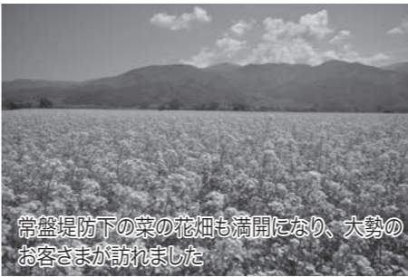
常盤堤防下の菜の花畑も満開になり、大勢のお客さまが訪れました