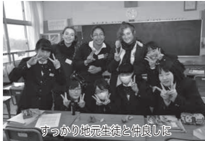
すっかり地元生徒と仲良しに

5月31日 第3回 信越自然郷いいやまアスパラまつり 開催 農林課 農業振興係 ☎62-3111 内線 262・263