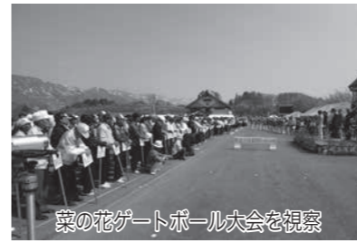
菜の花ゲートボール大会を視察