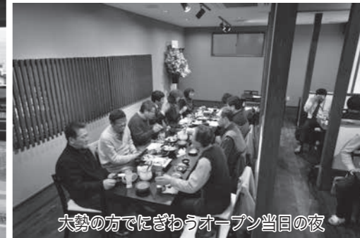
大勢の方でにぎわうオープン当日の夜