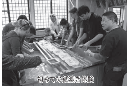
初めての紙漉き体験