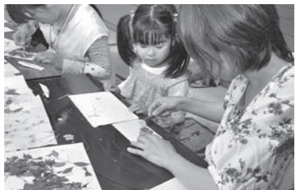
創作押し花が展示されていたこの民宿では押し花体験も可能で、楽しむ親子の姿がありました