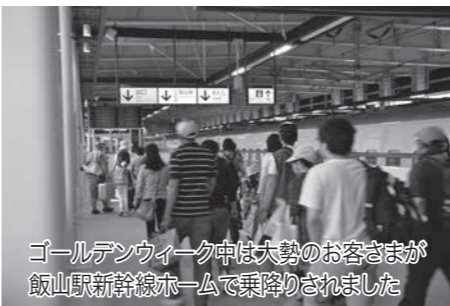
ゴールデンウィーク中は大勢のお客さまが飯山駅新幹線ホームで乗降されました

菜の花まつり会場にも新幹線に乗って東京、金沢から、また長野市や上田市など県内から「気軽に来ることができた」というお客さまもおられ、清々しい北信州の春を満喫し、帰路に着かれた方も多かったのではないのでしょうか。