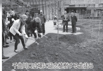
千曲川口広場に記念植樹する生徒ら