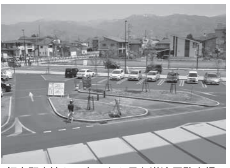
飯山駅交流センターから見た送迎用駐車場

市営駐車場は1時間まで無料です 飯山駅千曲川口の駐車場(写真)は送迎車で停車できる時間は30分間です。30分以上の駐車は斑尾口広場に併設された「市営駐車場」をご利用ください。市営駐車場は1時間まで無料です。斑尾口からも駅に入場できますのでご協力をお願いします。