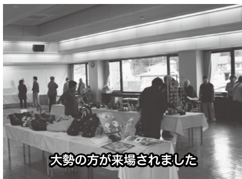
大勢の方が来場されました

今年は昨年よりも約200名多い646名の方が来場され、大勢の方に作品を見学していただく機会となりました。来場された方々は、熱心に作品に見入っていました。鑑賞した方からは「素敵な作品が見れてよかった」などの感想がありました。