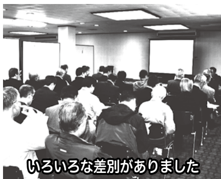
いろいろな差別がありました

◇飯山人権政策推進協議会総会 公運審に併せ18時30分から開催し、平成26年度事業報告、平成27年度事業計画を審議し承認されました。引き続きDVD鑑賞「身近な人権問題 人権は小さな気づきから」