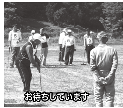
お待ちしております

・場所 戸狩小グラウンド ・参加者は太田公民館で随時受付中 ・申込先 太田公民館 ☎4579