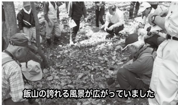
飯山の誇れる風景が広がっていました

また、県の史跡文化財にも指定されている勘介山古墳(飯山地域で初めて発見された前方後方墳)の学習会も行い、地元の自然と宝物を再認識しました。