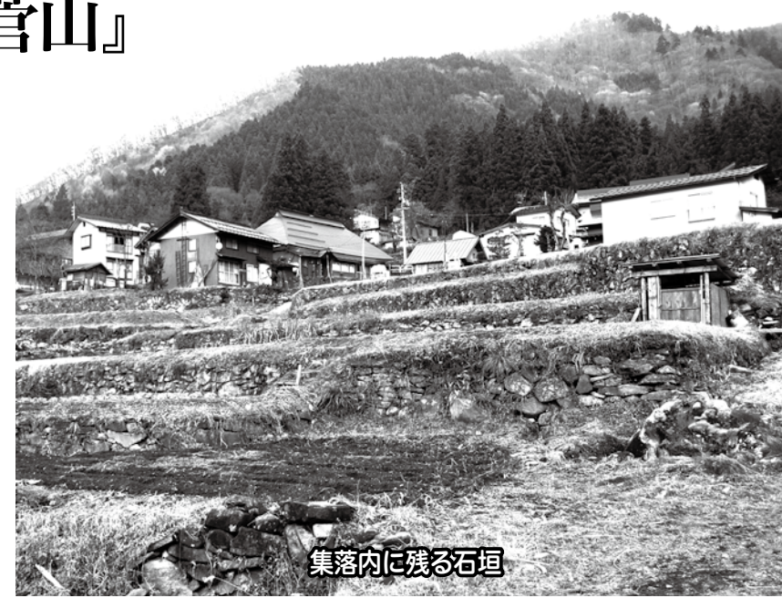
集落内に残る石垣