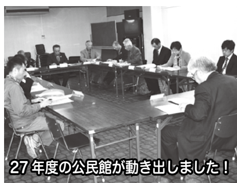
27年度の公民館が動き出しました！

4月18日(土)17時30分から開催し、平成26年度事業・決算報告、平成27年度事業計画・予算案等を審議し原案どおり承認され、新年度公民館活動がスタートしました。