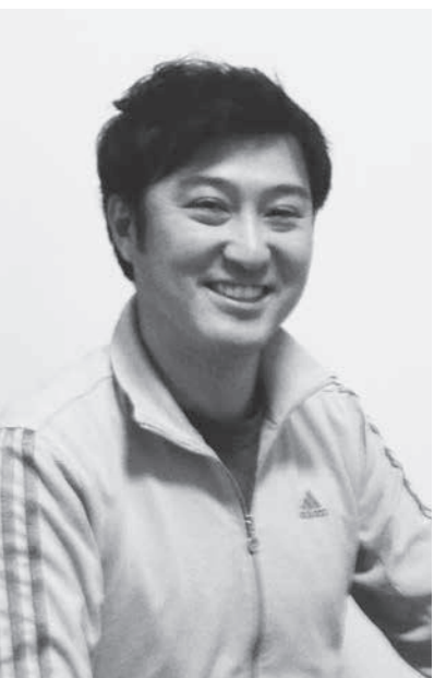
ものづくりが好き