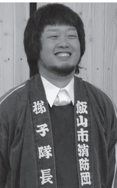
夢と希望を振りまいて