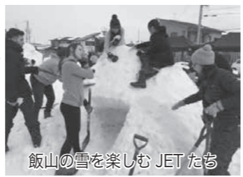
飯山の雪を楽しむJETたち

新幹線の開業で、東京とのつながりが効率よくなったとともに、他の都市、他の国との距離も短縮され、世界の中の位置も変わった飯山。2月初旬、こんな飯山に県内のJET (地方自治体、教育委員会および小中高校で、国際交流の業務と外国語教育に携わる人々) たちが集まり、かまくら作りや餅つきを行いました。年4回、季節ごとに県内で開かれる「Nagayes」というイベントは、県内のJETたちの交流の場で、声をかけ合い、派遣された地域の体験を紹介し合い、Naganoの“no”を“yes”と入れ替えるように、ネガティブな気持ちを、ポジティブに元気づけることが狙いなのです。