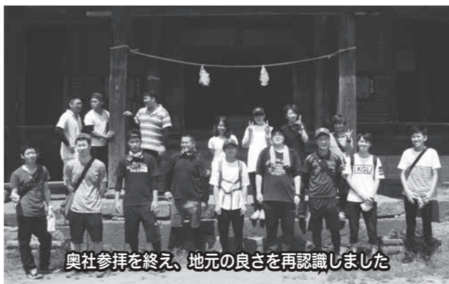
奥社参拝を終え、地元の良さを再認識しました

を行い新たな気持ちで成人をスタートし、あわせてふるさと飯山の良さを再認識しようと、企画されました。