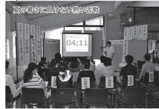
夏の暑さに負けぬ熱い舌戦