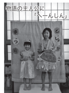
物語の主人公に「へーんしん」

力いただき本当にありがとうございます。このようなイベントを通じて、多くの方が図書館を訪れるきっかけになってほしいと思います。