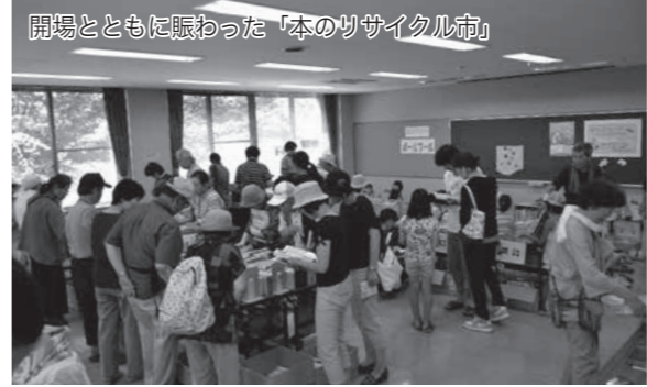
開場とともに賑わった「本のリサイクル市」

漫画『ベルサイユのばら』の原作者本人が、研究し調べ上げた史実を、その時代を生きた人物たちの姿とおして紐解いてゆく本著。漫画は史実を基にしたフィクションですが、そこから見える様々な人物の立場、当時のフランス社会の多面性は「物語」とおすることでより深く理解できます。秋の夜長のお供にぜひお手に取りください。