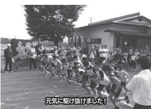
元気に駆け抜けました!

を設け65名の参加者により健脚を競い合いました。 地区の子どもたちには恒例行事であり、夏休みの思い出となりました。