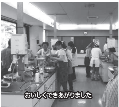
おいしくできあがりました