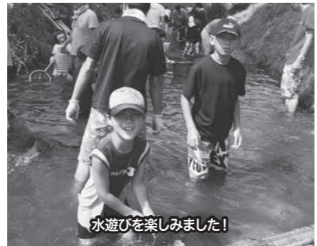
水遊びを楽しみました!

常盤地区育成のつどいということで、「ラフティング体験」を実施します。体験を通じて川についての学習や仲間同士での協力行動を学びます。 日時 9月24日(土)8時30分 場所 千曲川(常盤河川敷) 湯滝温泉 問合せ 常盤公民館 ☎3200