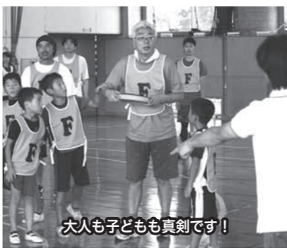
参加者数135名の大会となりました。

◇第2回飯山地区ドッチビー大会 ドッチビー大会を8月28日(日)飯山小学校体育館で開催しました。