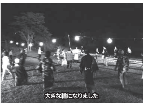
大きな輪になりました

場に会場を移して8月16日(火)に開催しました。木島平村、長野市長沼の愛好家の皆さんにもお越しいただき、大きな輪を描きながら踊ることができました。