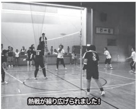
熱戦が繰り広げられました!

8月21日(日)に開催され、熱戦が繰り広げられました。 ソフトボール 優勝 本町A(本町) 準優勝 福寿町 第3位 本町B(本町) 第3位 北町A(北町)