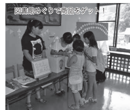
図書館めぐりで商品ゲット!

「いったい工作体験、さかなつり」「へーんしん」「本の福袋」と「しかんめぐり」「はらべこあおむしをそだてよう」「売店」などのイベントを開催し、多くの皆さんに楽しんでいただきました。図書館まつりは、前日準備から最後の片付けまで、ボランティアの皆さんの力をお借りして開催しています。ご協