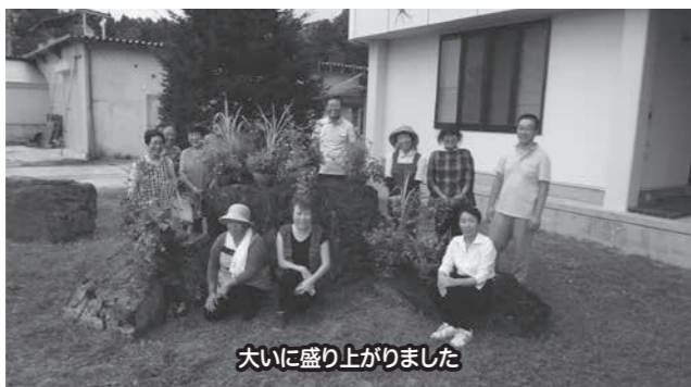
大いに盛り上がりました

9月13日(火)常盤活性化センターにて寄せ植え講習会が開催され11名が参加しました。これから楽しめる秋の花が数多く用意され、参加者が好みの花を使うことで、それぞれ華やかなオリジナル作品が完成しました。