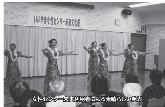
女性センター未来利用者による素晴らしい発表