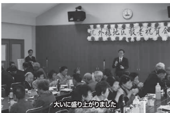
大いに盛り上がりました

今年10月22日(土)に前夜祭、23日(日)に文化祭を開催します。前夜祭では各種出し物をお楽しみいただき、文化祭ではお楽しみ抽選会なども企画しています。お誘いあわせのうえぜひお出かけください。