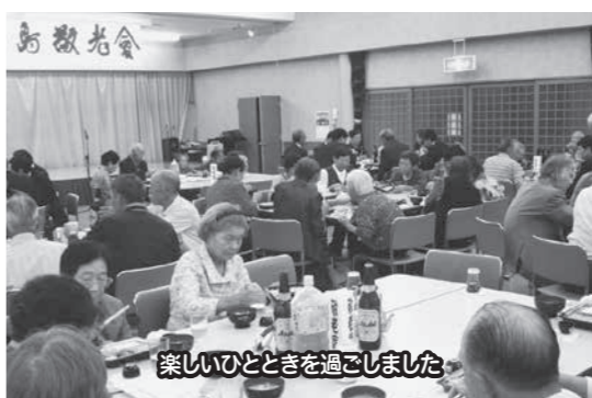
楽しいひとときを過ごしました

おいて開催されました。当日は77歳以上の敬老者および関係者約110名が集まりました。アトラクションでは木島小学校3年生の皆さん、木島童謡唱歌を歌う会の皆さん、フラダンスのカピリナナの皆さん、今年がマジックショーもあり大いに盛り上がりました。