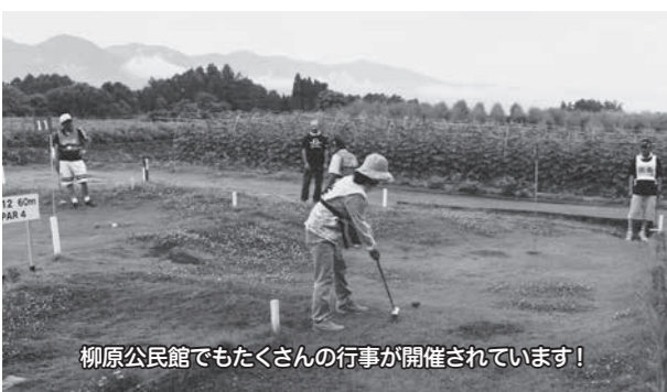
柳原公民館でもたくさんの行事が開催されています!

7月に行われた長野県公民館運営協議会主催の研修会に参加し、館報の発行目的、伝え方、載せ方、原稿の書き方など講演いただき大変勉強になりました。「館報とは?」という話を聞いた中では、行事の予告や結果、