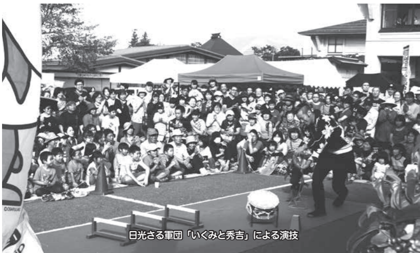
日光さる軍団「いくみと秀吉」による演技

飯山雪国大学演芸会「日光さる軍団いくみと秀吉」は大人気で、初回の講演となった文化交流館ならぬのホールは満員となり、外のモニターにも立ち見が出るほどでした。2回目以降は公民館での開催となりましたが、講堂に入りきららないなど、大盛況でした。女性センター未来の舞台発表では、準備したイスを追加するほど多くの方が来館され、各団体の演技を楽しみました。