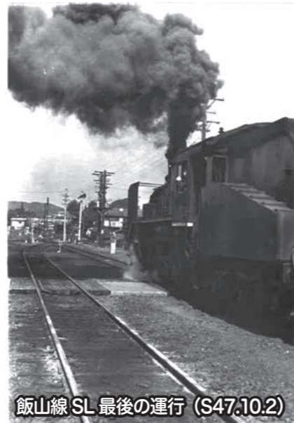
飯山線SL最後の運行(S47.10.2)