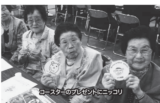
コースターのプレゼントにニコリ

9月22日(祝)、トピアホールを会場に、敬老会・合同金婚式を開催し、94名の皆さんに出席いただきました。とがり保育園月組の皆さんからコースターのプレゼントもありました。