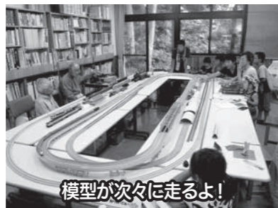
模型が次々に走るよ!