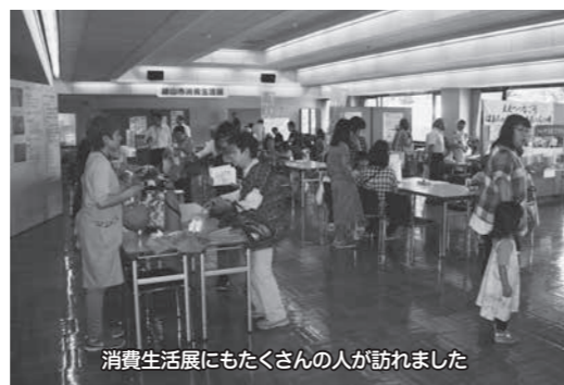
消費生活展にもたくさんの人が訪れました

初めて各館へ入った方も多くいるようで、「初めて女性センター未来へ入ってみました。素晴らしい作品がたくさん展示してあって感心した。」「公民館や美術館、ふるさと館など6館は、普段入ることがあまりないので、いい機会だった。さる軍団も楽しかったし、来年も楽しみにしている。などの感想が聞かれ、発表者、出品者は、「こんなに大勢の人が来てくれたら、これからの励みになる」と話していました。文教ゾーン6館がもっと身近に、気軽に集っていただけるといいなと思いました。