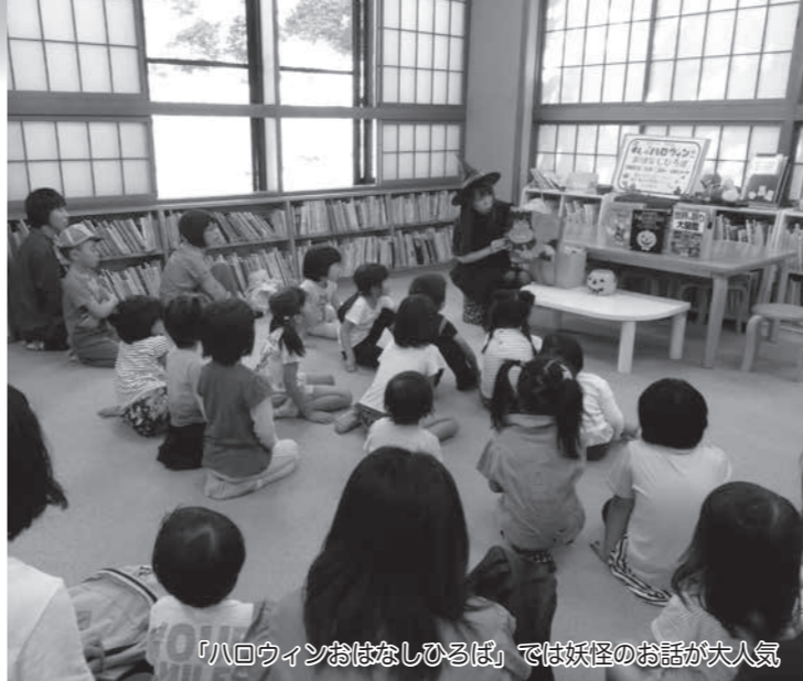
「ハロウィンおはなしひろば」では妖怪のお話が大人気

10月1日(土)・2日(日)に飯山市公民館・美術館・女性センター未来・ふるさと館・文化交流館なちゅうらと図書館の6館を会場として「見よう!学ぼう!集まろう!」学びのエリア秋まつり2016が開催されました。