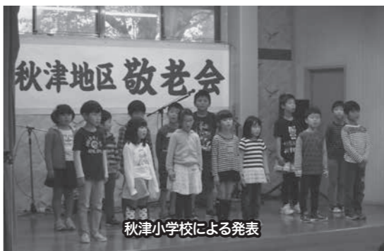
秋津小学校による発表

9月22日(祝)、秋津公民館において開催。当日は75歳以上の敬老者および関係者約120名が出席し、盛大に開催しました。