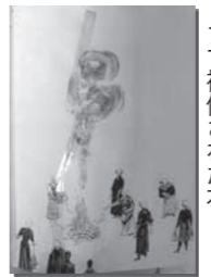
破損し、セロハンテープで補修された本

図書の修理は修理専用のテープやのりを使用します。(セロハンテープは時間が経つと劣化してかえって資料を傷めてしまいます)汚れたり破損してしまったら、自分で修理せずに、図書館に返却の際、必ず申し出てください。