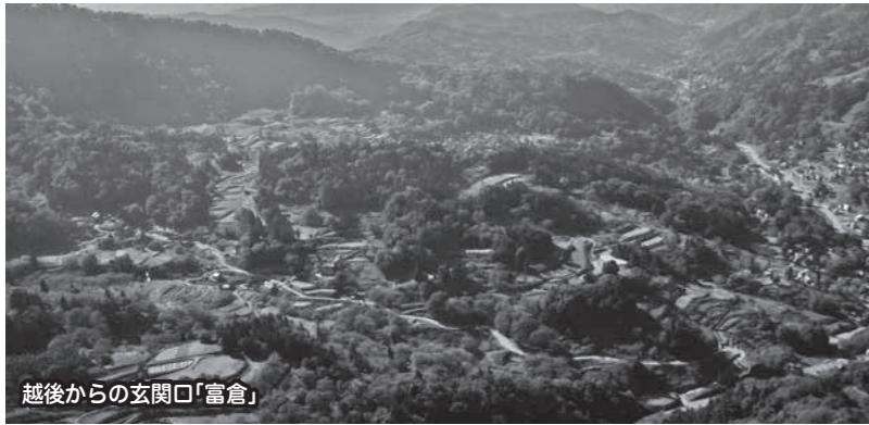
越後からの玄関口「富倉」

かつて盛んに人や馬、さまざまな物資が運ばれた街道の歴史を、地域に残る石造物や史跡、さまざまな文献・伝承からわかりやすく紹介します。