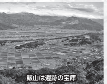
飯山は遺跡の宝庫