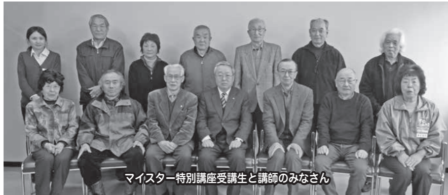
マイスター特別講座受講生と講師のみなさん

飯山について関心を高め、郷土愛を育むふるさと検定「マイスター特別講座」を開催 市民学習支援課文化財係では、ふるさと検定のマイスター合格者を対象にした「マイスター特別講座」を3月8日に飯山市公民館において開催しました。