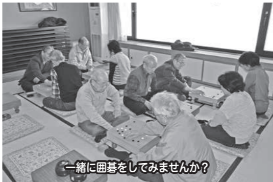
一緒に囲碁をしてみませんか？