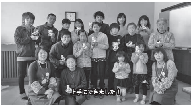
上手にできました!