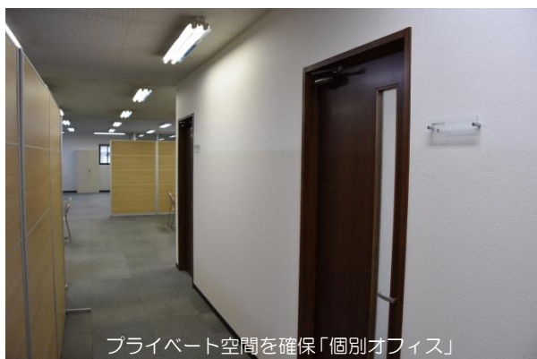
プライベート空間を確保「個別オフィス」