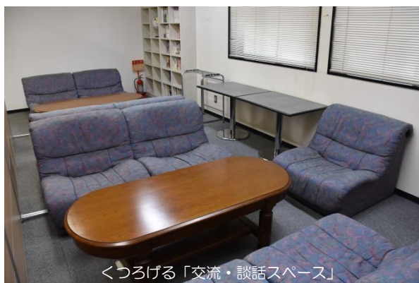
くつろげる「交流・談話スペース」