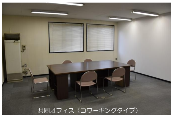
共同オフィス（コワーキングタイプ）