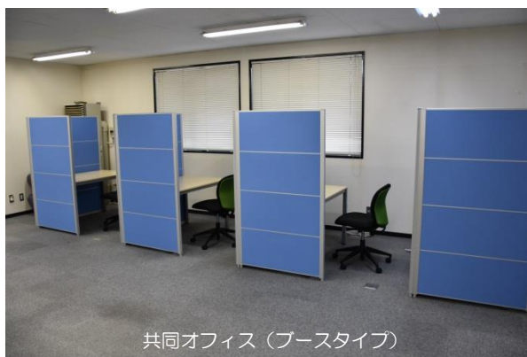
共同オフィス（ブースタイプ）