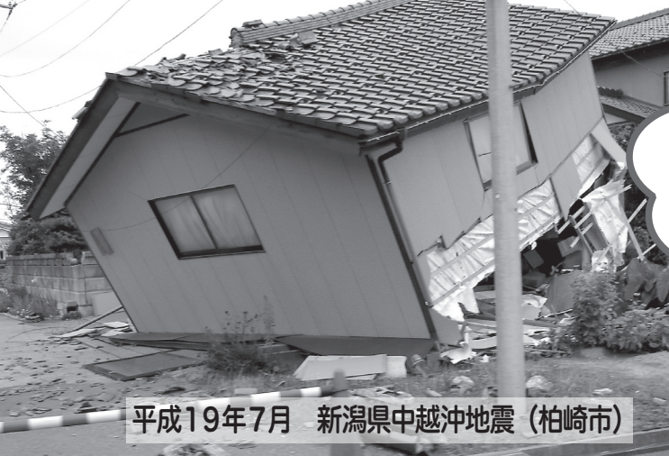
平成19年7月 新潟県中越沖地震（柏崎市）