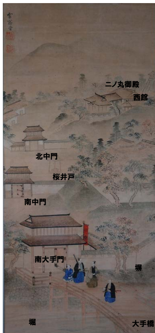
飯山城を鳥瞰で伝える絵図

中期の期間(約25年)を見据え、遺構の保存、復元、整備に関する取り組みの候補箇所を、緑色:保存、茶色:復元、橙色:整備(既存施設の移設)として区分し、下図に示しました。