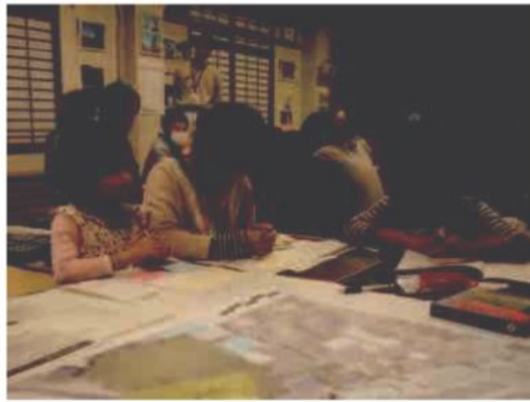
子供も一緒に考えました！

はじめに、各自に用意された作業シートへ記入しました。名前などの基本的な項目や、どのような公園にしたいのかなど、個人の考えをまとめました。