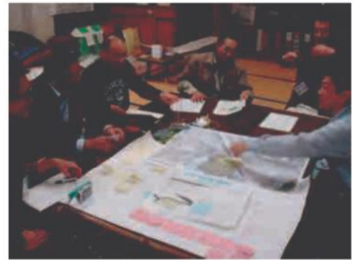
お父さんたちも盛り上がりました！

続いて、各グループでの話し合いを行いました。1人1人が作業シートに書き込んだ内容を発表し、出た内容をもとにさらに意見交換を行いました。