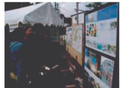
真野研究室の活動紹介（パネル展）