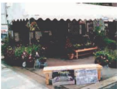
←←権利者の方々に行った 寄せ植え講習会での作品の展示