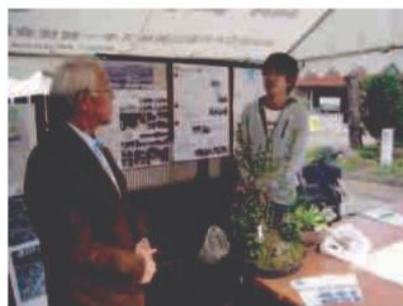
地元飯山の方や近隣の方々から お話を伺いました→→