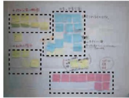
みんなの考えをグループ化しました