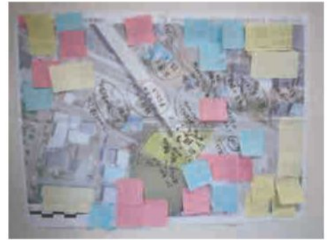
航空写真への書き込み