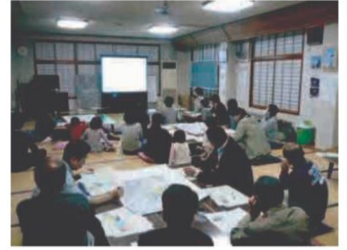
ワークショップでの一場面

ワークショップでは3つのグループに別れて、現在どのような公園を利用しているのか、新しい公園をどのような公園にしたいのか、などを話し合いました。