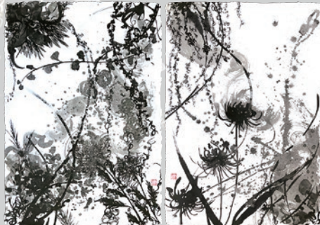
@Werkhalle Wiesenburg Berlin, 15.09.2023

筆の動きや身体の所作、墨の滴る音、道具が発する微かな響きまでもが表現の一部として扱われる。視覚と聴覚が交差するなかで、その瞬間にしか存在しない何かがうまれる。