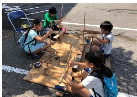
▲火起こし体験、火がついたかな？