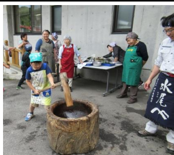
▲笹もちづくり、餅つきから