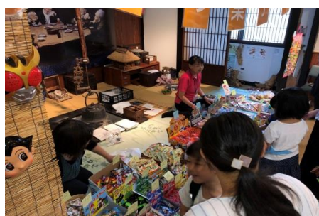
▲毎年人気の“なつ菓子屋”に集まる子どもたち