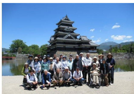
▲H31. 5. 23松本城にて