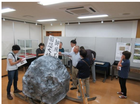
▲善光寺地震から考える展示説明