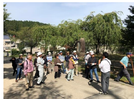
▲R1. 9. 20 飯山城現地学習会