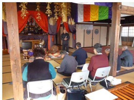
▲R1. 11. 26 永国寺の学習