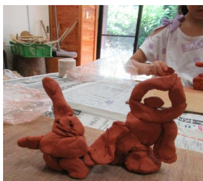
▲土器作り・自分だけの土偶を作る