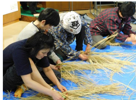
▲わらぐつ作り講習会にて