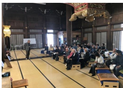
▲R1. 10. 23 勝興寺にてボランティアガイドの説明を聞く