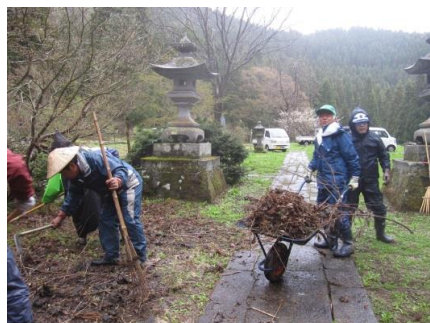
▲H31. 4. 27 大聖院周辺の清掃