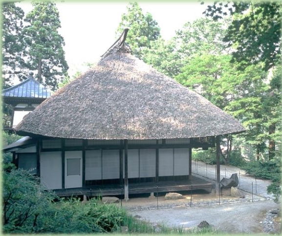
恵端禅師旧跡正受庵