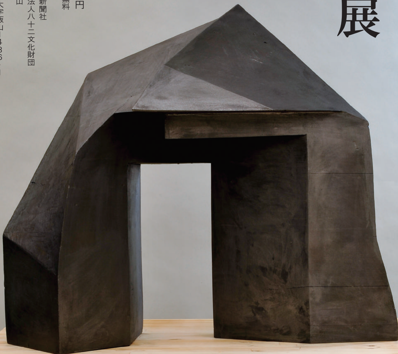
より添う形・門 2017 80×97×90 cm スプルース材、グラファイト

飯山市美術館 〒389-2253 長野県飯山市大字飯山1436-1 ☎0269-62-1501 http://muse.city.iiyama.nagano.jp/