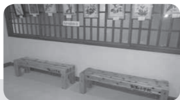
飯山小学校 様から 湯の入荘へ寄付され た木製ベンチ