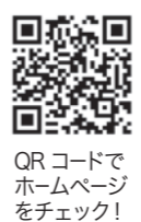
QRコードでホームページをチェック！

★飯山市の移住定住情報サイトをリニューアルしました！（関連裏表紙） スマートフォンにも対応し、移住相談会や空き家バンクの情報などが見やすく、探しやすくなりました。市内の取材記事等も掲載しています。ぜひ一度ご覧ください。 「いよいよやま住んでみませんか？飯山市ふるさと回帰支援センター」サイト https://furusato-ityama.net