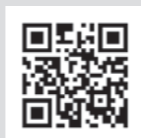
QRコードでホームページをチェック!

国税庁ホームページの「確定申告書等作成コーナー」をご利用いただくと夜間や休日など、ご都合の良い時間に作成することができます。「ID・パスワード方式の届出完了通知」をお持ちの方は、1月からIDとパスワードを入力すればe-Taxで申告することができます。詳しくは、国税庁ホームページ( http://www.nta.go.jp )をご覧ください。 e-Tax・作成コーナーヘルプデスク☎0570-01-5901(平日)までお問い合わせください。