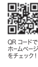
QRコードでホームページをチェック！