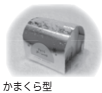
かまくら型スノーショコラも販売