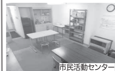
市民活動センター

福祉センター1階奥にある市民活動センターと1階エレベーターホールをフリースペースとして開放しています。今まで貸出しに申請が必要だった市民活動センターも原則自由にお使いいただけます。エレベーターホールは誰でも自由に使える方もそのまま利用していただくことが可能です。ちょっとした休憩や待ち合せの場に皆さんお気軽にご利用ください。また、掲示板には、随時ボランティア情報等を掲示しています。