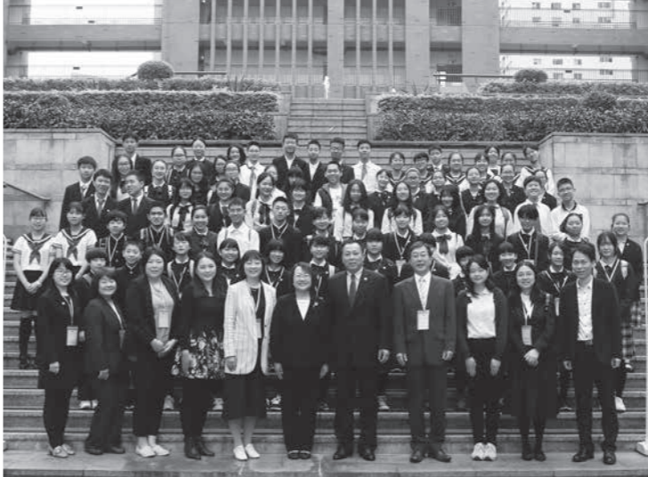
交流訪問団と深圳外国語学校の皆さん

「中国と日本の文化の違いを学んできた」「深圳の皆さんにたくさん質問したい」 中国深圳市の深圳外国語学校への交流訪問団生徒の決意表明の言葉です。