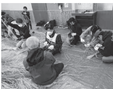
ていねいにコツを教わりました