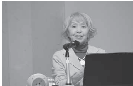
たくさん話題に触れた講演でした

講演ではフィンランドの冬の景色や生活が紹介されるとともに、ムーミンの作中に登場するキャラクター