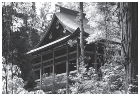
小菅神社奥社本殿(国重要文化財)

そして奥社参道をのぼっていくと、小菅山中腹に小菅神社奥社本殿(国重要文化財)があります。険しい岩陰に建てられた建物は壮観で、まさに修験信仰の核となる建物だと実感させられます。