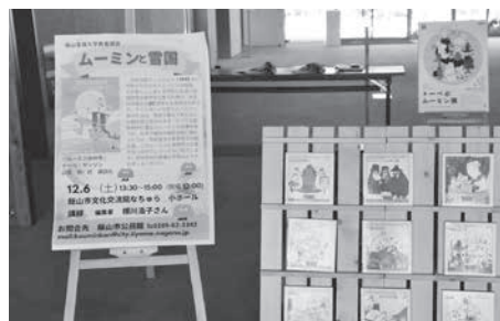
ロビーでは絵本やコミック版を展示しました

強制をせず、安心して自分らしく育てていく子育て法について語られ、ムーミンの作風にも大きな影響を与えたフィンランドの文化について知ることができました。