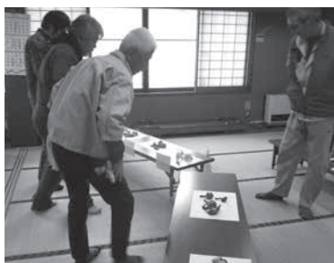
地域できのこの呼び名も違います