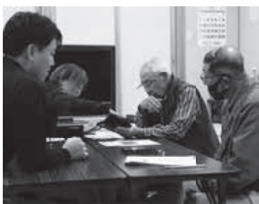
スマホの楽しみ方を学びました

今年もご高齢の方の参加がありました。スマホは日常的に使用されており、更なる向上心を持って参加されていました。