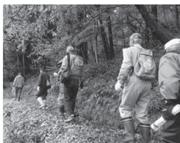
散策しながら楽しく学びました

参加者は、先生のお話に耳を傾けながら辺りを見渡し、遠い昔に思いをはせていました。