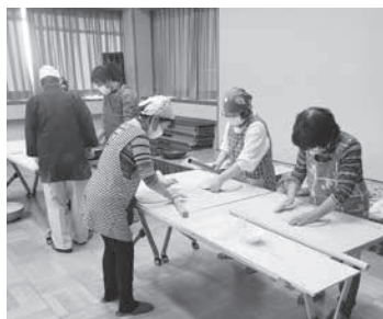
打ちたてのそばを楽しみました

初めて参加された方は悪戦苦闘の末、何とか出来上がりしました。試食会では、おそらく先生が打ったそばではない形のものもありましたが、打ちたてのボクチそば、二八そばを堪能することが出来ました。