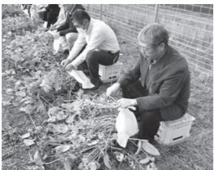
▲丹波黒豆のほ場見学