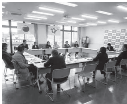
▲若狭町農業委員会と意見交換会