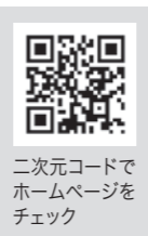
二次元コードでホームページをチェック

また、年間約50人のインターンシップの受け入れも行われており、地域農業を牽引する次世代の育成に努めている点に感銘を受けました。