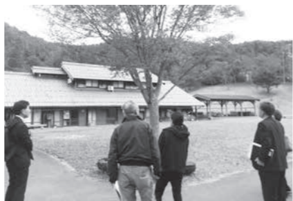
▲かみなか農楽舎を見学