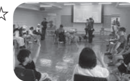
聴導犬学習の様子