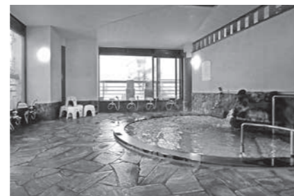
源泉100%の温泉で癒しの時間をお過ごしいただけます。

湯の入荘の送迎車は配車計画に沿って運行しております。ご利用を希望される方は、社協だより30ページの「送迎/行事計画」をご確認ください。