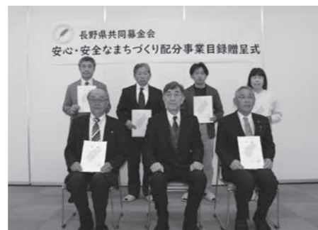
長野県共同募金会 安心・安全なまちづくり配分事業目録贈呈式

自治力の形成をはじめとした地域福祉の裾野を広げる活動を資金面から支援することを目的として、長野県共同募金会から配分されるものです。 配分が決定された6団体は左記のとおりです。テントや発電機など、いずれも災害に対応した備品の整備に配分金を活用する予定です。