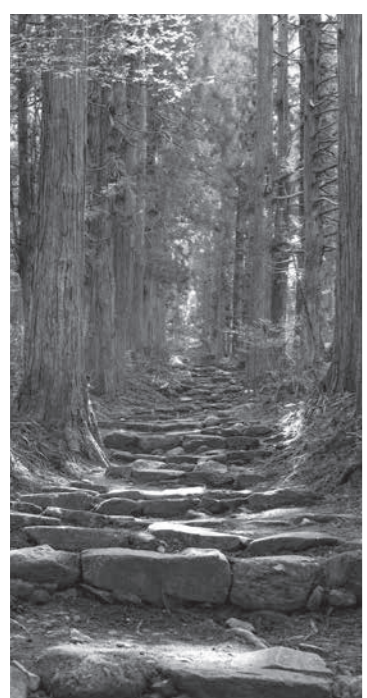
小菅神社の杉並木

季節ごとにお散歩のように楽しめる市内の文化財スポットを紹介している「お散歩文化財」。今月も歴史に詳しい、イイヤマはかせと、飯山のいいところを見つけたい、めつけちゃん、が飯山を巡ります。第3回は瑞穂地区の「小菅の里」へ訪れました。 めつけ・大きな門だね！この門は何？ はかせ…これは「小菅の仁王門」といって江戸時代の造りと言われているんだよ。坂道を上って行ってみよう。 めつけ…広々としたところに着いたよ！あの赤い屋根の大きな建物は何？ はかせ…小菅の講堂だよ。