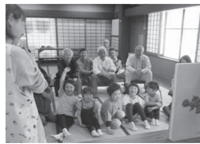
紙芝居をみて、一緒に脳トレをしました