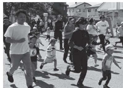
お父さん、お母さんと一緒に

地域の役員さんたちのご協力のおかげで、今回は園児や低学年のちびっ子ランナーが主役の、笑顔あふれるあたたかい大会となりました。参加されたみなさん、おつかれさまでした！