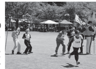
大盛り上がりのパン食い競争