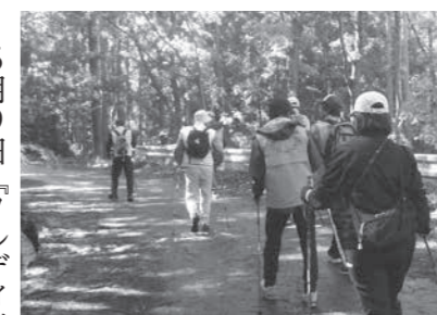
景色を楽しみながら歩きました