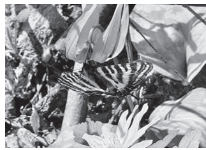
カタクリ・ギフチョウ・イチゲの花