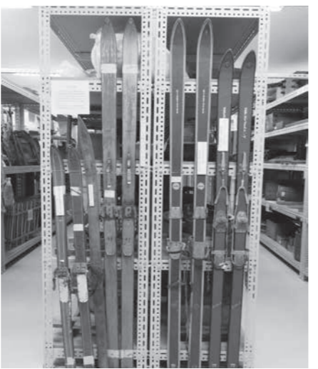
昭和に生産が盛んになったスキー板