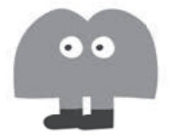
学びのエリアキャラクター マナビン